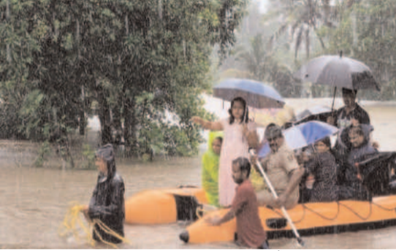
सुरक्षा सुनिश्चित करने के लिए एहतियाती कदम उठाते हुए यह फैसला लिया गया है। डीडीपीआई सूचकांक मंद्ने ने एक परिपत्र जारी कर इस आदेश को लागू किया है। भारी बारिश को देखते हुए जिला कलेक्टर ने स्कूलों में दो दिन की छुट्टी घोषित कर दी है। बच्चों की

जलाशयों से लगातार पानी छोड़े जाने के कारण भीमा नदी का जलस्तर खतरनाक स्तर पर पहुंच गया है। देवगांव स्थित अंजनेय मंदिर पूरी तरह जलमग्न हो गया है। पुराना थावरखेड़ा गाँव, गंगापुर संगम क्षेत्र स्थित परायण मंडप, फडगुरा गाँव स्थित पशुपालन अस्पताल और महुरा गाँव समेत कई इलाके जलमग्न हो गए हैं। यादगिरी जिले के वडगेरा तालुका में गुरुसगरी ब्रिज कंपनी बैराज से भीमा नदी में 3.5 लाख क्यूसेक पानी छोड़ा गया है। बाढ़ में फंसे 8 लोगों को सिंदगी अनिशमन दल ने बचाकर सुरक्षित स्थान पर पहुंचाया है। भीमा नदी का पानी यादगिरी और रायचूर जिलों के कुछ गाँवों में घुस गया है, जिससे सड़क संपर्क टूट गया है।