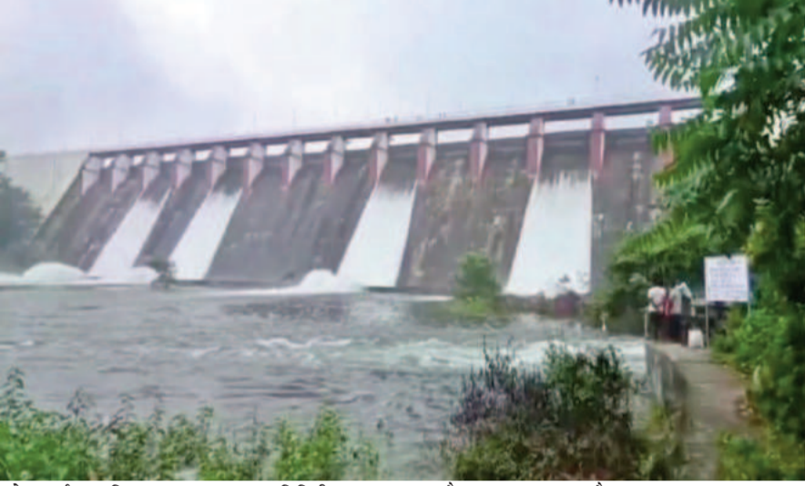
को एलर्ट कर दिया गया था, साथ ही कोडरमा, हजारीबाग, गिरिडीह, जामताड़ा और धनबाद जिला प्रशासन को भी अलर्ट भेजा गया है। आला अधिकारी रख रहे

संवाददाता कोडरमा : लगातार हो रही बारिश के बाद तिलैया डैम का जलस्तर बढ़ गया है और डैम की सुरक्षा के मद्देनजर 4 फाटक खोल कर डैम के पानी को डिस्चार्ज किया जा रहा है। डीवीसी प्रबंधन की ओर से मिली जानकारी के अनुसार सोमवार की रात साढ़े 9 बजे डैम के 4 गेट खोले गए हैं और प्रति सेकेंड 500 क्यूसेक पानी डिस्चार्ज किया जा रहा है। लोगों को एलर्ट किया गया डैम के फाटक खोले जाने से पहले सोमवार की शाम आसपास के गांव में माइकिंग के जरिये लोगों