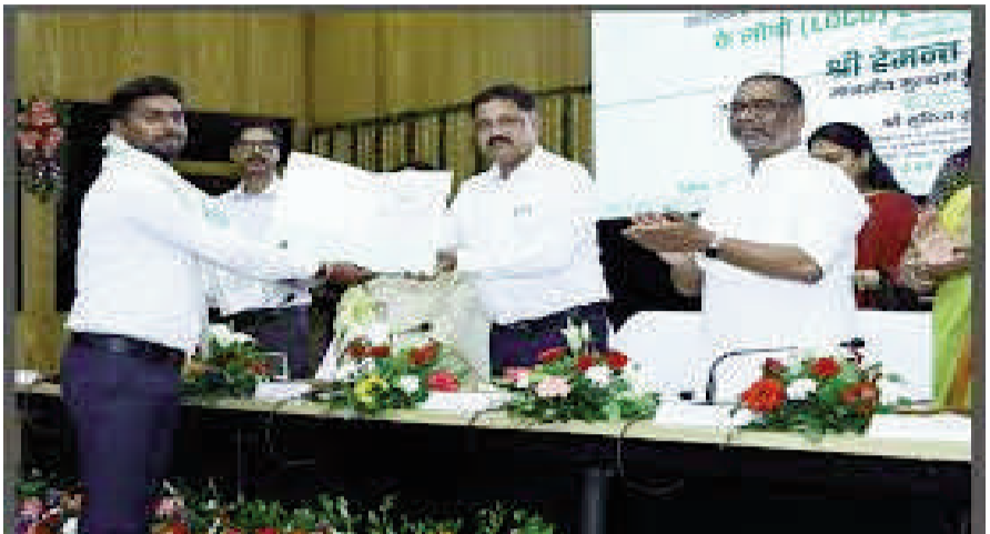
शुरूआत कर सकें। शिक्षा विभाग के सूत्रों के अनुसार, नियुक्ति प्रक्रिया को

संवाददाता रांची : राज्य सरकार ने स्पष्ट कर दिया है कि प्रशिक्षित सहायक आचार्य के सभी सफल घोषित अभ्यर्थियों को 30 सितंबर से पूर्व नियुक्ति पत्र दे दिए जाएंगे। कुल 4333 अभ्यर्थियों में से अब तक सीमित संख्या को ही नियुक्ति पत्र सौंपा गया है, जबकि शेष 4120 से अधिक अभ्यर्थियों की नियुक्ति प्रक्रिया अंतिम चरण में है। सरकार का प्रयास है कि आगामी दशहरा त्योहार से पूर्व सभी सफल उम्मीदवारों को नियुक्ति पत्र मिल जाए, ताकि वे अपने परिवारों के साथ खुशियां बाँट सकें और नई जिम्मेदारी को