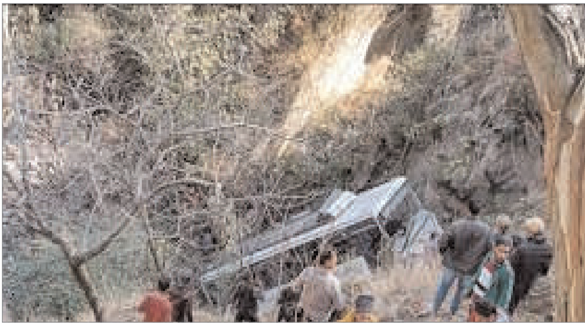
देवी 42.0, बरटी 37.4 व करसोग में 34.2 मिलीमीटर बारिश हुई। उपमंडल के तहत आने वाली बीती रात को भूस्खलन की चपेट में आने से चार लोगों की मौत हो मंडी जिले के सुंदरनगर निहरी तहसील के बगटा गांव में

शिमला: हिमाचल प्रदेश में बारिश ने फिर कहर बरपाया है। बीती रात हुई भारी बारिश से राजधानी शिमला, मंडी व अन्य भागों में तबाही हुई है। शिमला में 141.0 मिलीमीटर बारिश दर्ज की गई जोकि बहुत ज्यादा है। जगह-जगह भूस्खलन से राज्य में सैकड़ों सड़के, बिजली ट्रांसफार्मर बंद हैं। मंडी जिले में भूस्खलन से तीन लोगों की मौत हो गई। एक लापता है। मंगलवार सुबह 10:00 बजे तक राज्य में तीन नेशनल हाईवे सहित 653 सड़के बंद रही। 1205 बिजली ट्रांसफार्मर व 160 जल आपूर्ति स्कीमों भी बाधित हैं। मंडी जिले में 313, कुल्लू 153, शिमला 58 व चंबा में 26 सड़के बंद हैं। बीती रात नगरोटा सूरियां 135.2, भटियात 80.0, सुंदरनगर 60.5, सलापड़ 57.9, ब्राह्मणी 54.4, गुलेर 54.2, मंडी 52.6, कांगड़ा 50.5, मेहरे बड़सर 50.0, नयना देवी 46.8, मुरारी