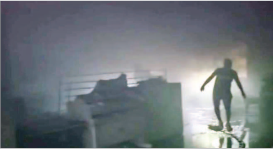
दमकल विभाग की कई गाड़ियां मशकत के बाद आग पर काबू सेंटर में रखे करीब 40 कंप्यूटर, मौके पर पहुंचीं और घंटों की पाया जा सका। इस घटना में डेटा 10 एयर कंडीशनर और अन्य

प्रत्यक्षदर्शियों के मुताबिक, आग लगते ही पूरे परिसर में धुआं फैल गया और अफरा-तफरी का माहौल बन गया। सूचना मिलते ही