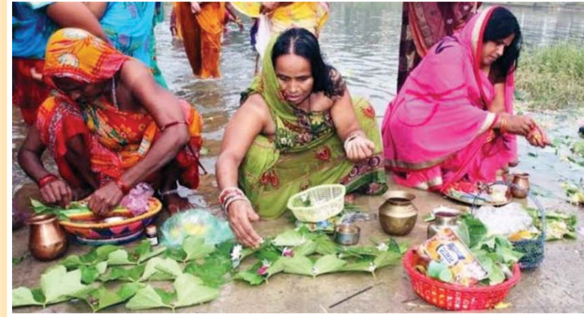
जितिया व्रत पर अनुष्ठान करती माताएं।

नई दिल्ली। पूरी दुनिया में आलोचकों के निशाने पर आने के बावजूद और भारत से मार खाने के बावजूद पाकिस्तान, आतंक को वित्तपोषित करने की अपनी आदत से अभी भी बाज नहीं आ रहा है। भारतीय वायुसेना ने ऑपरेशन सिंदूर के दौरान पाकिस्तान में स्थित कई आतंकी ठिकानों को तबाह कर दिया था। अब सैटेलाइट तस्वीरों से पता चला है कि पाकिस्तान द्वारा फिर से इन आतंकी ठिकानों का पुनर्निर्माण किया जा रहा है।