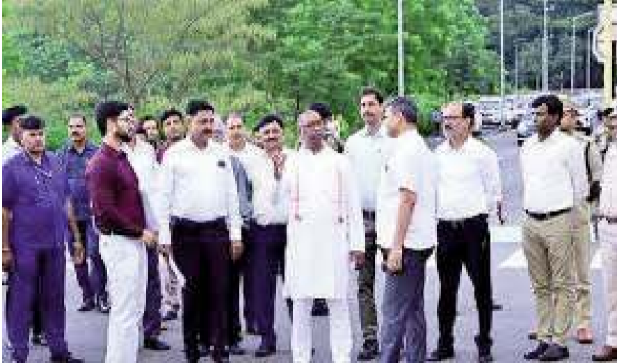
कुमार, नगर विकास विभाग के स्मार्ट सिटी के सीईओ सूरज नंदकुलियार सहित अन्य अधिकारी मौजूद थे।

संवाददाता रांची : मुख्यमंत्री हेमन्त सोरेन ने शुक्रांशु स्थित स्मार्ट सिटी परियोजना के तहत बन रहे कन्वेंशन सेंटर का सोमवार को निरीक्षण किया। उन्होंने अधिकारियों से पूरे काम की जानकारी ली। अधिकारियों ने बताया कि 2018 में 5 हजार लोगों की क्षमता वाले इस कन्वेंशन सेंटर का काम शुरू हुआ था, लेकिन बीच में ही यह बंद हो गया। मुख्यमंत्री ने कहा कि राज्य हित में इस सेंटर का बेहतर उपयोग करने के लिए ठोस योजना बनाई जाए। निरीक्षण के दौरान नगर विकास मंत्री सुदिव्य कुमार, मुख्यमंत्री के अपर मुख्य सचिव अविनाश