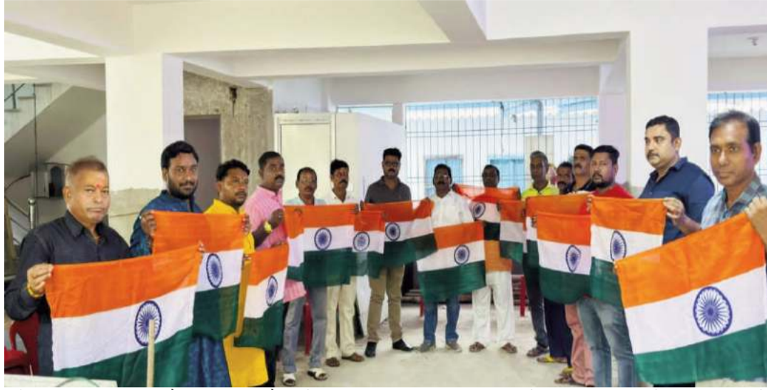
पहुंचाना हम सबका कर्तव्य है। बैठक में निर्णय लिया गया कि दुमका नगर में तिरंगा यात्रा का आयोजन कर जनता को

संवाददाता दुमका : भारतीय जनता पार्टी दुमका द्वारा हर घर तिरंगा झारखंड यात्रा 2025 के सफल और भव्य बनाने के उद्देश्य से शनिवार को दुमका नगर में एक महत्वपूर्ण कार्यशाला शिवपहाड़ में आयोजित किया गया। इस कार्यशाला में पार्टी के पदाधिकारी, जनप्रतिनिधि, विभिन्न मोर्चों के कार्यकर्ता एवं सामाजिक संगठनों के प्रतिनिधि बड़ी संख्या में उपस्थित रहे। कार्यशाला में हर घर तिरंगा अभियान के अंतर्गत आगामी कार्यक्रमों की रूपरेखा, प्रचार-प्रसार की रणनीति, बूथ स्तर तक कार्यकर्ताओं की सक्रिय भागीदारी और जनजागरण अभियान के तौर-तरीकों पर विस्तार से चर्चा की गई। वक्ताओं ने कहा कि यह अभियान सिर्फ एक कार्यक्रम नहीं, बल्कि राष्ट्र के गौरव, एकता और अखंडता का प्रतीक है, जिसे घर-घर तक