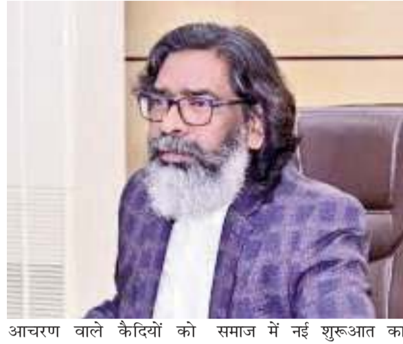
आचरण वाले कैदियों को समाज में नई शुरुआत का

गया। कुल मिलाकर 103 कैदियों के मामलों पर विस्तार से चर्चा की गई। मुख्यमंत्री ने रिहाई हेतु अनुशंसित कैदियों के अपराध की प्रवृत्ति, उम्र, पारिवारिक व सामाजिक पृष्ठभूमि, जेल में आचरण, स्वास्थ्य स्थिति और संबंधित अधिकारियों की रिपोर्ट का गहन अध्ययन किया। विचार-विमर्श के बाद 51 कैदियों को रिहाई पर सहमति दी गई। सीएम सोरेन ने कहा कि 14 वर्ष या उससे अधिक समय से सजा काट रहे, वृद्ध और अच्छे