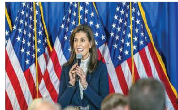
खतरा नहीं है। उन्होंने भारत को एक बहुमूल्य लोकतांत्रिक साझेदार बताते हुए कहा कि चीन के मुकाबले भारत के पास

का मुकाबला करने के लिए भारत को सहयोगी और लोकतांत्रिक साझेदार के रूप में देखना जरूरी है। उन्होंने चेतावनी दी कि भारत के साथ संबंधों को तोड़ना अमेरिका के लिए एक रणनीतिक आपदा साबित होगा। पिछले 25 वर्षों में दोनों देशों के रिश्ते मजबूत हुए हैं और इस रफ्तार को रोकना खतरनाक कदम होगा। चीन से निपटने के लिए भारत अहम: हेली ने कहा कि भारत का लोकतांत्रिक उदय कम्युनिस्ट चीन के विपरीत स्वतंत्र दुनिया के लिए