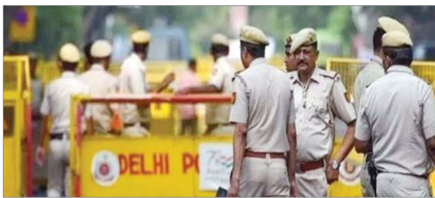
पुलिस को एक पीसीआर कॉल मिली, जिसमें एक घर में लोगों के खून से लथपथ पड़े होने की जानकारी दी गई। जब पुलिस मौके पर पहुँची, तो घर के अंदर का दृश्य देखकर वे हैरान रह गए।