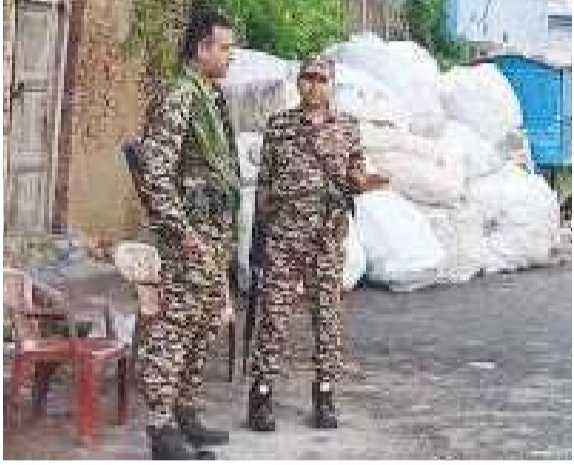
शोघन निवारण अधिनियम (पीएमएएल) के तहत तीन राज्यों में 12 परिसरों पर छापेमारी की गयी थी।