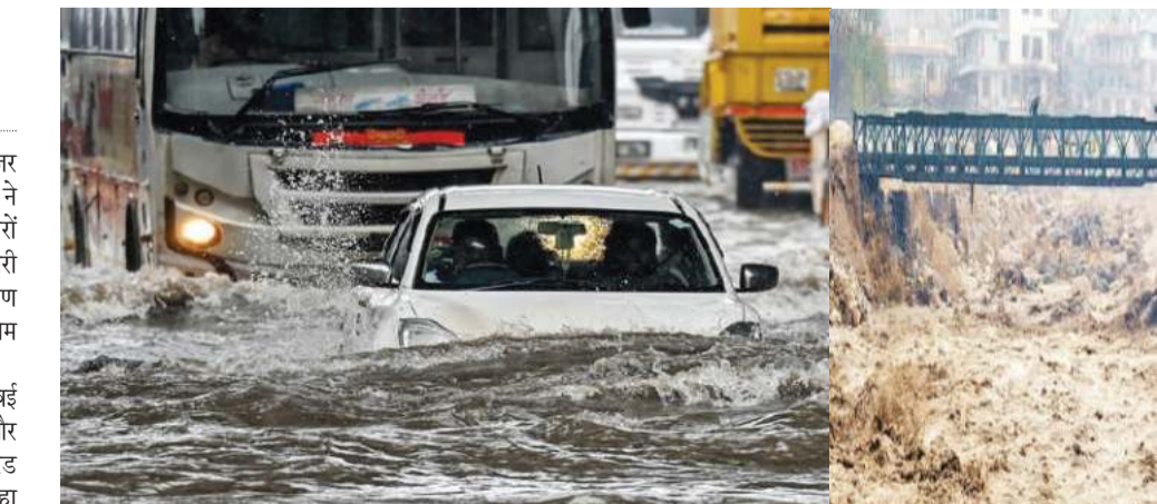
अवकाश घोषित किया है। बीएमसी ने मुंबई महानगरीय क्षेत्र के सभी निजी कार्यालयों और प्रतिष्ठानों से अपील की है कि वे अपने कर्मचारियों को तत्काल वर्क-फ्रॉम-होम की सुविधा दें और कार्य की प्रकृति के अनुसार अनावश्यक यात्रा से बचने के निर्देश जारी करें। इसी तरह, नवी

मुंबई: मुंबई में भारी बारिश के मद्देनजर बृहन्मुंबई महानगरपालिका (बीएमसी) ने घोषणा की है कि मुंबई शहर और उपनगरों में स्थित सभी सरकारी और अर्ध-सरकारी कार्यालय बंद रहेंगे। भारी बारिश के कारण बीएमसी ने कर्मचारियों को वर्क फ्रॉम होम की सलाह दी है। भारतीय मौसम विभाग ने बृहन्मुंबई महानगरपालिका क्षेत्र (मुंबई शहर और उपनगर) के लिए भारी वर्षा को लेकर रेड अलर्ट जारी किया है। एक बयान में कहा गया, वर्तमान में मुंबई में लगातार मूसलाधार बारिश हो रही है। इस स्थिति को देखते हुए, जिला आपदा प्रबंधन प्राधिकरण के रूप में कार्य करते हुए बीएमसी ने आवश्यक सेवाओं को छोड़कर क्षेत्र के सभी सरकारी, अर्ध-सरकारी और बीएमसी कार्यालयों में मंगलवार को