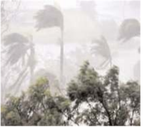
पूर्वी जिलों में, जबकि 21 और 22 अगस्त को उत्तर-पूर्वी और दक्षिणी जिलों में भारी बारिश की चेतावनी जारी की गई है। पिछले 24 घंटे में कई जिलों में हल्की से मध्यम

रांची : राज्य में 24 अगस्त तक कई हिस्सों में भारी बारिश और वज्रपात की संभावना है। मौसम विभाग ने बताया कि अगले दो दिनों में तापमान में 2-3 डिग्री सेल्सियस की गिरावट आ सकती है। हालांकि, तीन दिनों में मौसम में किसी बड़े बदलाव की संभावना नहीं है।