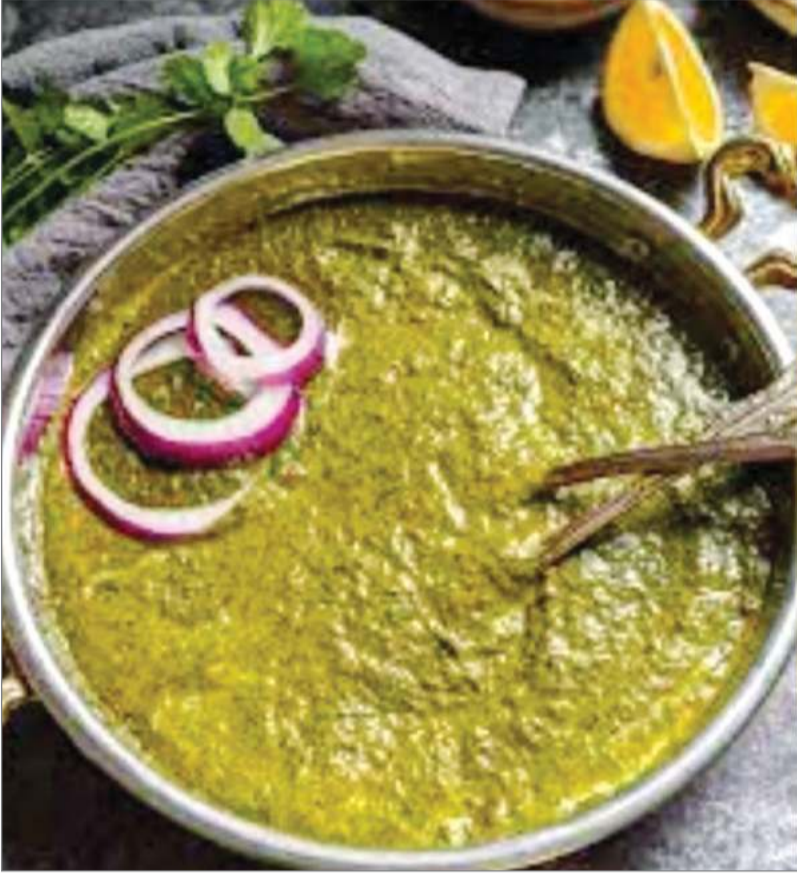
हरी पत्तेदार सब्जियाँ, खासकर साग नहीं खानी चाहिए। इसके पीछे ठोस कारण हैं: कमजोर पाचन: मानसून में

कढ़ी और साग से दूरी क्यों? जानें ठोस कारण: आपने अक्सर सुना होगा कि सावन में कढ़ी और