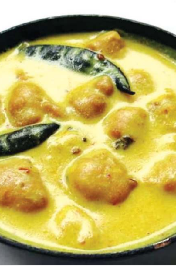
आयुर्वेद कहता है कि इस मौसम में हमें हल्का और सुपाच्य भोजन ही करना चाहिए।

साग जैसी हरी पत्तेदार सब्जियों में कीड़े और गंदगी छिपी होने की आशंका ज्यादा रहती है जिससे संक्रमण का खतरा बढ़ जाता है।