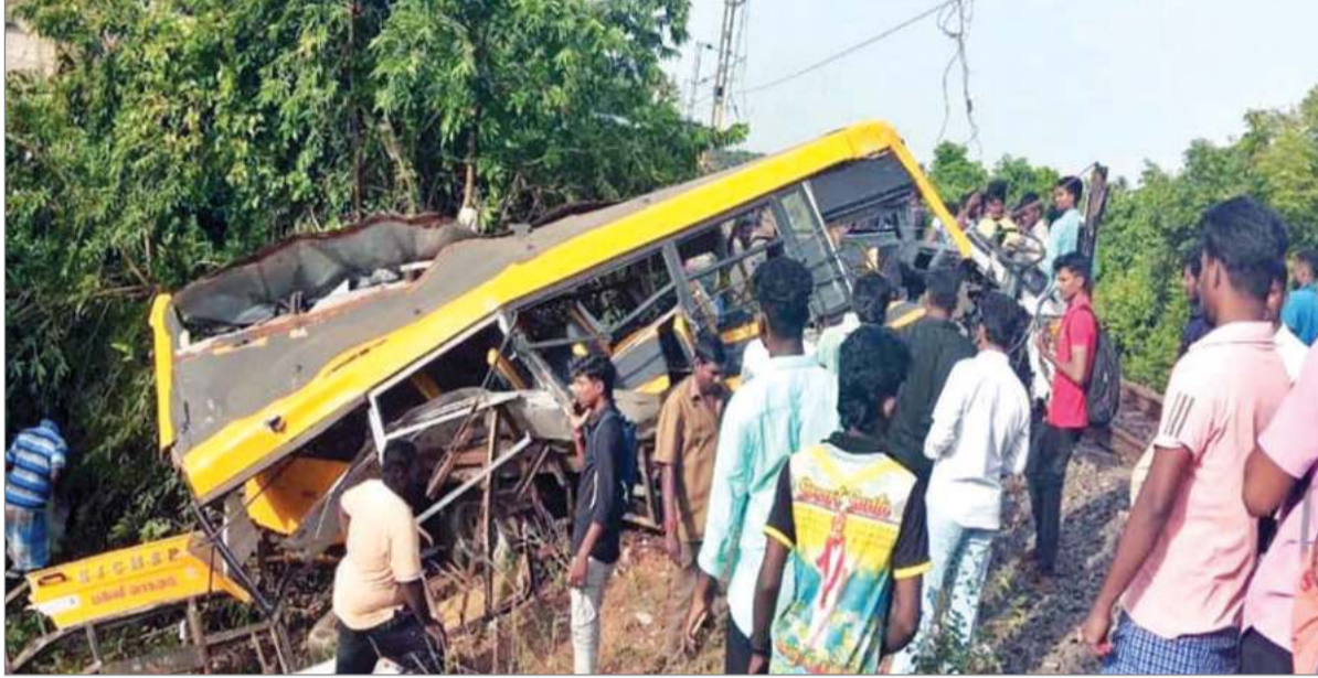
छात्रों की हालत गंभीर बताई जा रही है। प्रत्यक्षदर्शियों ने बताया कि

यह घटना उस समय हुई जब स्कूल बस चेम्न कुप्पम के पास रेलवे ट्रैक पार करने की कोशिश कर रही थी। चिदंबरम जाने वाली एक यात्री ट्रेन वैन से टकरा गई, जो लगभग 50 मीटर तक उसे घसीटते हुए ले गई। टक्कर के कारण बस बुरी तरह क्षतिग्रस्त हो गई और तीन बच्चों ने मौके पर ही दम तोड़ दिया। इस दुर्घटना में मृतकों की संख्या बढ़ने की आशंका है, क्योंकि कुछ और