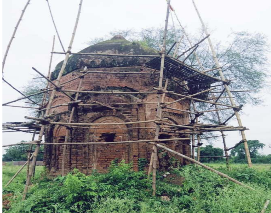
भी बंद कर कब्जा कर लिया है। उन्होंने कहा है कि जमिन कब्जाने वाले लोग कट्टरपंथि मानसिकता के व अपराधिक गतिविधि से संबंध रखता है। मंदिर में पूजा अर्चना पर धमकी देता है।

खतियानी रैयत हिंदु है। मौजा सिरासिन 159, जमा० नं०-181 कुल रकबा 12-08-00 बारह बिघा आठ कटठा, जमा० नं०-157 कुल रकबा-06-07-00 छह बिघा सात कटठा जमाबंदी नं०-174 कुल कुल दाग-15 कुल रकबा-19-10-00 19 बिघा दस कटठा जमाबंदी नं०-176 कुल दाग-3 कुल रकबा-05-19-00 पाँच बिघा उन्नीस कटठा हैं। वर्तमान में जमाबंदी 176 के दाग नं०-232, जमाबंदी 157 के दाग नं०-233, जमाबंदी 174 के दाग नं०-227 और जमाबंदी 181 पर अबैध निर्माण चल रहा है। उक्त जमाबंदी का सारा जमिन मंदिर से लगी हुई है। परंतु चंद भूमाफिया उक्त जमीन को हड़पने में लगे हुए हैं। जिसमें उक्त जमीन पर अबैध तरीके से कब्जा कर पोखर पटाल, ग्रामिन सड़क अनावादी, पुरातन पतित, लाखाज द्वार आदि सारा नष्ट कर दिया है। यहाँ तक कि मंदिर जाने का रास्ता