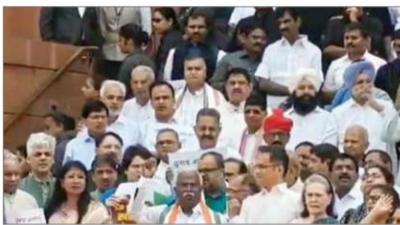
दलों के सदस्य संसद परिसर के मकर द्वार पर एकजुट हुए और जोरदार विरोध प्रदर्शन किया। इस दौरान एसआईआर मुद्दे पर नरिबाजी की गई सोनिया गांधी भी इसमें शामिल हुईं। वहीं प्रियंका गांधी ने खरने में लोकतंत्र लिखा पोस्टर लहराया। कांग्रेस सांसद प्रियंका गांधी वाड़ा ने कहा, जब भी विपक्षी नेता

सदन की कार्यवाही स्थगित होने पर विपक्षी दलों के सदस्यों ने संसद के बाहर विरोध प्रदर्शन किया। बैनर-पोस्टर लेकर विपक्षी