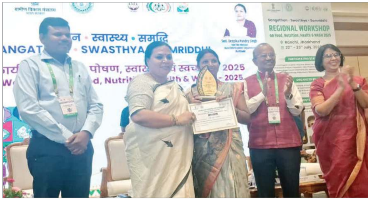
स्वावलंबी बना रही है, बल्कि उनमें आत्मविश्वास भी पैदा कर रही है। सभी योजनाओं को धरातल पर उतरने में

राज्य सरकार भी राज्य की महिलाओं को सशक्त करने के लिए कई तरह की योजनाएं चला रही हैं। मई-जून में समान योजना के रूप में 2500 रुपये महिलाओं को देकर सरकार न सिर्फ उन्हें