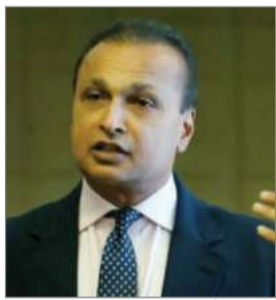
योजना का खुलासा हुआ है। साथ ही, यस बैंक लिमिटेड के प्रमोटर सहित बैंक अधिकारियों को रिश्त देते का अपराध भी जांच के दायरे में है।

समूह द्वारा मनी लॉन्ड्रिंग के अपराध की जांच शुरू कर दी। सूत्रों के अनुसार, इस मामले में नेशनल हाउसिंग बैंक, सेबी, नेशनल फाइनेंशियल रिपोर्टिंग अथॉरिटी (एनएफआरए), बैंक ऑफ बड़ोदा जैसे अन्य एजेंसियों और संस्थानों ने भी ईडी के साथ जानकारी साझा की। ईडी की प्रारंभिक जांच में बैंकों, शेयरधारकों, निवेशकों और अन्य सार्वजनिक संस्थानों के साथ धोखाधड़ी करके जनता के पैसों को इधर-उधर करने/निपटाने की एक सुनियोजित और सोची-समझी