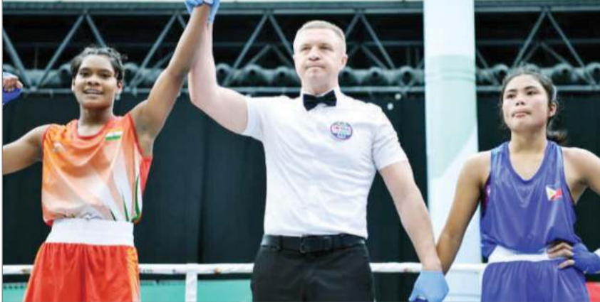
सिल्वर मेडल जीतकर देश का अंतरराष्ट्रीय स्तर पर हूए गौरव बढ़ाया था। इसके अलावा एक्सपोजर टूर में भी उन्होंने मेडल हासिल किया। उनके निरंतर प्रदर्शन और मेहनत को

हाल ही में उन्होंने जूनियर वर्ल्ड बॉक्सिंग चैंपियनशिप में