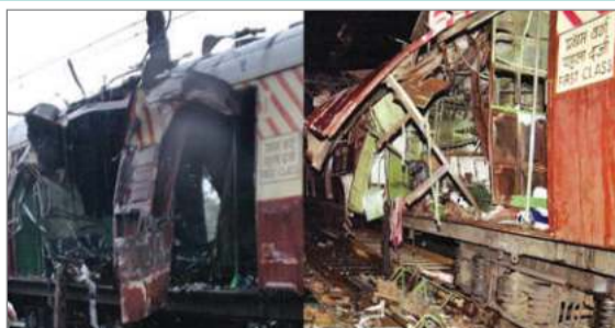
शाम 12 में से दो आरोपियों को नागपुर सेंट्रल जेल से रिहा कर दिया गया था। हाईकोर्ट के इस फैसले पर अब सुप्रीम कोर्ट ने रोक लगा दी है। इसके साथ ही 1 महोदयों के भीतर जवाब दाखिल करने का आदेश दिया है। यह मामला 11 जुलाई 2006 का है, जब मुंबई की लोकल ट्रेनों में शाम के समय मात्र 11 मिनट के अंदर सात अलग-अलग जगहों पर सीरियल बम धमाके हुए थे। इन धमाकों में 189 लोगों की जान चली गई थी और 827 से अधिक लोग घायल हुए थे। इस घटना ने पूरे देश को झकझोर दिया था। जनवरी 2006 में इस मामले में चार्जशीट दाखिल की गई थी। इसके बाद 2015 में ट्रायल कोर्ट ने 12 आरोपियों को दोषी ठहराया था, जिसमें 5 को फांसी और 7 को उम्रकैद की सजा सुनाई गई थी। इसके बाद आरोपियों ने हाईकोर्ट में अपील दायर की थी। जनवरी 2025 में इस मामले की सुनवाई पूरी हुई थी, और तब से कोर्ट ने अपना फैसला सुरक्षित रखा था। वेरवडा, नाशिक, अमरावती और नागपुर जेल में बंद आरोपियों को वीडियो कॉन्फ्रेंसिंग के जरिए कोर्ट में पेश किया गया।

मुंबई : सुप्रीम कोर्ट ने गुरुवार को 2006 के मुंबई लोकल ट्रेन विस्फोट मामले में बॉम्बे हाईकोर्ट के 12 आरोपियों को बरी करने के फैसले पर अंतरिम रोक लगा दी है। हालांकि, शीर्ष अदालत ने स्पष्ट किया है कि आरोपियों की रिहाई पर फिलहाल कोई रोक नहीं लगाई गई है। महाराष्ट्र सरकार ने बॉम्बे हाईकोर्ट के सभी आरोपियों को बरी करने के फैसले को चुनौती देते हुए कोर्ट में याचिका दायर की है। मुंबई में साल 2006 में हुए सीरियल बम ब्लास्ट मामले में सोमवार को हाईकोर्ट ने 12 आरोपियों को बरी कर दिया था। कोर्ट के आदेश के बाद सोमवार