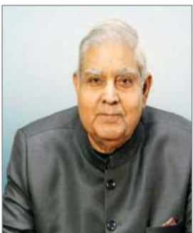
नई दिल्ली : उपराष्ट्रपति जगदीप धनखड़ का इस्तीफा