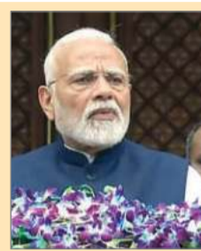
राज्यसभा की कार्यवाही शुरू हुई, तो उपसभापति हरिवंश ने सदन की अध्यक्षता की। बाद में

नई दिल्ली : उपराष्ट्रपति जगदीप धनखड़ का इस्तीफा मंजूर कर लिया गया है। बीते दिन ही धनखड़ ने राष्ट्रपति मुर्मू को पत्र भेजकर पद से इस्तीफा की बात कही थी। उन्होंने इस्तीफा के पीछे स्वास्थ्य कारणों का हवाला दिया था। मंगलवार को राज्यसभा को जगदीप धनखड़ के तत्काल प्रभाव से इस्तीफे के संबंध में गृह मंत्रालय की अधिसूचना (दिनांक 22 जुलाई) के बारे में सूचित किया गया। इस बीच प्रधानमंत्री नरेंद्र मोदी ने 'एक्स' पर पोस्ट कर धनखड़ के उत्तम स्वास्थ्य की कामना की। उन्होंने लिखा, 'जगदीप धनखड़ को भारत के उपराष्ट्रपति सहित कई भूमिकाओं में देश की सेवा करने का अवसर मिला है। मैं उनके उत्तम स्वास्थ्य की कामना करता हूँ।'