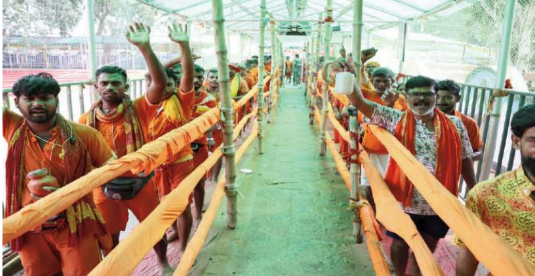
किसी भी परिस्थिति में अपना ड्यूटी स्थल एवं विधि व्यवस्था प्राथमिकता होनी या आपात स्थिति उत्पन्न न हो, इसका नहीं छोड़ें। श्रद्धालुओं की सुरक्षा, सुविधा चाहिए। किसी भी प्रकार की अव्यवस्था विशेष ध्यान रखें। निरीक्षण के दौरान