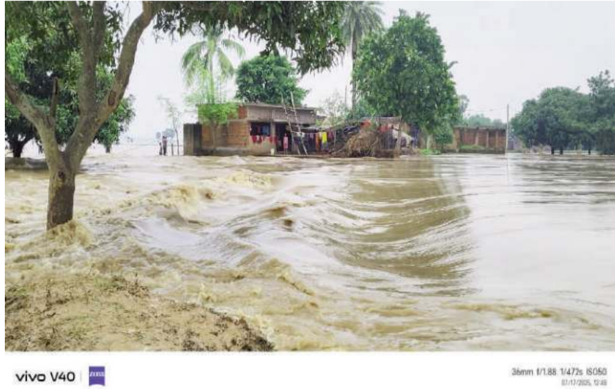
दिए। उन्होंने कहा कि संभावित बाढ़ की स्थिति से निपटने के लिए प्रशासनिक तैयारी पूर्ण होनी चाहिए। ग्रामीणों की सुरक्षा, अस्थायी शरणस्थलों की व्यवस्था व आवश्यक राहत सामग्री की उपलब्धता सुनिश्चित करने की अपील की गई है। स्थानीय प्रशासन अलर्ट मोड

प्रभावित गाँवों में फैली चिंता गुमानी नदी के जलस्तर में वृद्धि के चलते पुरूलिया डांगा, चांदपुर, जमालपुर, अंधारकोटा हरिहारा चाकपाड़ा, महेशघाटी,