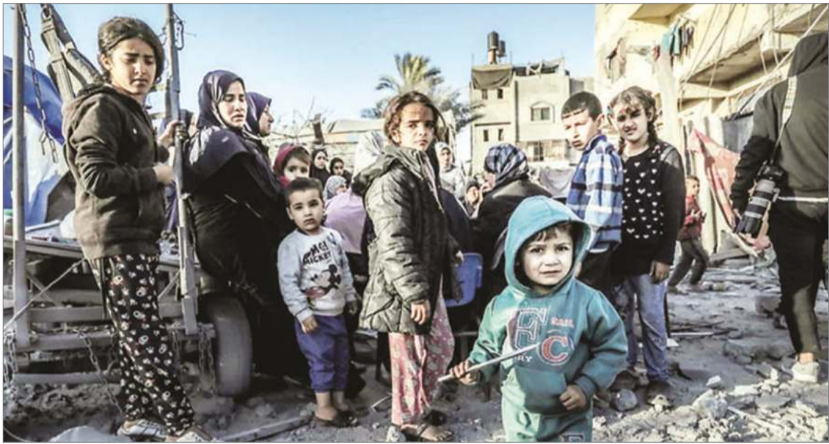
खुनी दिन पर आई है, जब चिकित्सा सूत्रों ने बताया कि राफा में जीएचएफ द्वारा संचालित सहायता केंद्र के पास 45 लोग मारे गए। विवादास्पद अमरीकी और इजरायल समर्थित जीएचएफ ने मई में अपना संचालन शुरू करने के बाद से गाजा के संयुक्त

एजेंसी/ यरूशलम: फिलिस्तीनी शरणार्थियों के लिए संयुक्त राष्ट्र एजेंसी के प्रमुख ने कहा है कि इजरायल गाजा में नरसंहार की एक क्रूर और चालाक योजना को अंजाम दे रहा है और मई से सहायता मांगते हुए लगभग 800 फिलिस्तीनी मारे जा चुके हैं। यह रिपोर्ट अल जजीरा ने शनिवार को पेश की। यूएनआरडब्ल्यूए प्रमुख फिलिप लाजारिनी ने शुक्रवार को एक्स पर एक पोस्ट में कहा कि हमारी निगरानी में, गाजा बच्चों और भूखे लोगों के लिए कब्रिस्तान बन गया है। लाजारिनी गुरुवार को मध्य गाजा शहर देर अल-बला में पोषण संबंधी पूरक आहार के लिए कतार में खड़े नौ बच्चों और चार महिलाओं सहित 15 लोगों की इजरायली सेना द्वारा हत्या पर प्रतिक्रिया व्यक्त कर रहे थे। उनकी यह टिप्पणी गाजा पट्टी में एक और