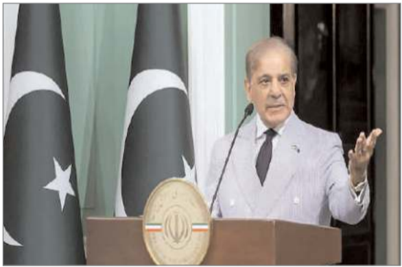
हमले के जवाब में भारतीय सेना द्वारा चलाए गए ऑपरेशन सिंदूर के बाद आया है। इस ऑपरेशन के तहत भारतीय सैन्य बलों ने पाकिस्तान अधिकृत कश्मीर और पाकिस्तान के भीतर मौजूद आतंकी टिकानों पर सर्जिकल हमले किए थे। बहावलपुर स्थित जैश-ए-मोहम्मद के टिकानों

नई दिल्ली : ऑपरेशन सिंदूर के दौरान भारत को बार-बार परमाणु हमले की गीदड़भभकी देने वाला पाकिस्तान अब पीछे हटता दिख रहा है। हाल ही में पाकिस्तान के प्रधानमंत्री शहबाज शरीफ ने भारत के साथ संभावित परमाणु संघर्ष की आशंकाओं को सिरे से खारिज कर दिया है। यह बयान भारतीय सैन्य कार्रवाई के कुछ ही दिनों बाद आया है। इस्लामाबाद में छात्रों को संबोधित करते हुए शरीफ ने कहा, पाकिस्तान का परमाणु कार्यक्रम पूरी तरह से शांति बनाए रखने और अपने राष्ट्रीय हितों की रक्षा के लिए है, न कि आक्रामकता के लिए। ऑपरेशन सिंदूर के बाद बदला लहजा: प्रधानमंत्री शरीफ का यह बयान जम्मू-कश्मीर के पहलगाव में 22 अप्रैल को हुए आतंकी