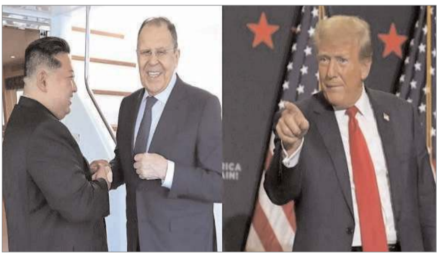
एक जैसी राय रखते हैं, और यह रिश्ता अब चुकना है। लावरोव ने तब तक पहुंच चुका है। लावरोव ने दोनों देशों के बीच रणनीतिक साझेदारी और अंतरराष्ट्रीय मंचों पर साझा गतिविधियों को तेज करने की बात कही। पिछले कुछ वर्षों में रूस और उत्तर कोरिया के रिश्ते काफी नजदीक हुए हैं। रिपोर्टों के मुताबिक, उत्तर कोरिया रूस को यूक्रेन युद्ध में हथियार और सैनिक मदद दे रहा है, जबकि रूस उत्तर कोरिया को सैन्य और आर्थिक समर्थन दे रहा है। इस बढ़ती

एजेंसी/सियोल : रूस के विदेश मंत्री सर्गेई लावरोव ने अमेरिका, दक्षिण कोरिया और जापान को उत्तर कोरिया के खिलाफ सैन्य गठबंधन बनाने को लेकर सख्त चेतावनी दी है। यह बयान उन्होंने शनिवार को उत्तर कोरिया के वोनसान शहर में किम जोंग उन से मुलाकात के दौरान दिया। इस मुलाकात में रूस और उत्तर कोरिया के बीच सैन्य और आर्थिक सहयोग को और आगे बढ़ाने पर चर्चा हुई। लावरोव ने रूसी राष्ट्रपति व्लादिमीर पुतिन का संदेश भी किम तक पहुंचाया। इस मौके पर किम जोंग उन ने कहा कि उनका देश यूक्रेन युद्ध में रूस का बिना शर्त समर्थन करेगा। उत्तर कोरिया की सरकारी एजेंसी डउठअ के मुताबिक, किम ने कहा कि प्योंगयांग और मॉस्को सभी बड़े अंतरराष्ट्रीय मामलों पर