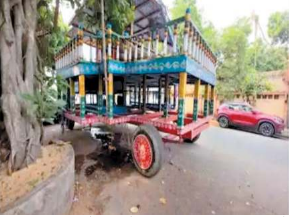
इस बार 27 जून को निकलने वाली रथ यात्रा के दौरान भगवान जगन्नाथ का रथ इन्हीं नए टायरों पर यात्रा करेगा। इस्कॉन

कोलकाता : इस्कॉन कोलकाता की इस साल की भगवान जगन्नाथ रथ यात्रा में एक अनोखा नवाचार देखने को मिलेगा। भगवान के रथ पर अब एयरक्राफ्ट नहीं, बल्कि भारतीय वायुसेना के अत्याधुनिक सुखोई चौथा पीढ़ी के फाइटर जेट्स में इस्तेमाल होने वाले टायर लगाए गए हैं। पिछले 48 वर्षों से इस रथ पर बोइंग विमान के टायर उपयोग में लाए जा रहे थे, लेकिन अब उनकी जगह नए और अधिक टिकाऊ सुखोई टायरों ने ले ली है।