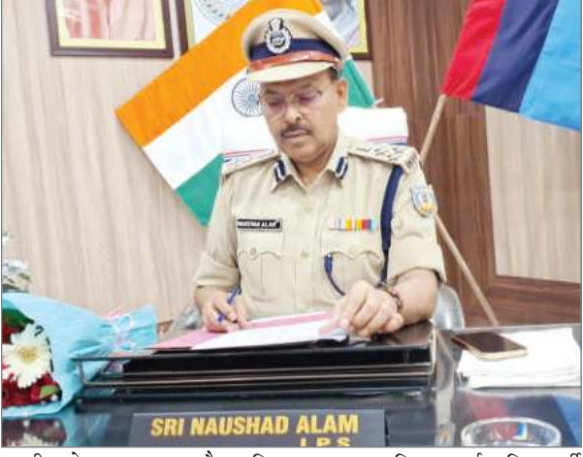
तस्वीर होना आवश्यक है, ताकि आम नागरिक को यह भ्रम न रहे कि वह किससे संवाद कर रहा है। डीआईजी ने नाराजगी जताते हुए कहा कि- कई पुलिसकर्मी अपने आधिकारिक मोबाइल पर पारिवारिक या गैर-पेशेवर तस्वीरें लगाए हुए हैं, जो विभाग की