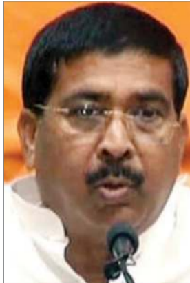
बकाए का भुगतान राज्य सरकार ने लाकए रखा है। विधवा पेंशन, वृद्धा पेंशन की राशि महीनों से नहीं मिल रही।

संवाददाता रांची: कल यानी 24 जून को भाजपा कार्यकर्ता राज्य के सभी 264 प्रखंडों में आक्रोश प्रदर्शन कर प्रखंड विकास पदाधिकारी के माध्यम से उपायुक्त के नाम ज्ञापन सौंपेंगे। यह जानकारी पार्टी के प्रदेश महामंत्री एवं सांसद आदित्य साहू ने दी। आदित्य साहू ने कहा कि हेमंत सरकार पा 2 की कार्यशैली, नीति और नीयत में कोई परिवर्तन नहीं आया है। यह सरकार फिर से राज्य के खजानों, खनिज संपदा को लू ले लुवाने में लगी है। राज्य के पंचायतों से लेकर सचिवालय तक आकंट भ्रष्टाचार है। कोई काम बिना पैसे का चढ़ावा चढ़ाए नहीं हो रहा। गरीब जनता अपने छो-छो काम के लिए दर-दर भ्रष्टाचार कर रही। दलाल विचौलिए सत्ता में हावी है। उन्होंने कहा कि राज्य सरकार निकाय चुनाव को लगातार लाकए रखी है। नियोजन नीति और भाषा विवाद में बेरोजगार युवक ठगे जा रहे। सड़क, बिजली, अस्पताल, दवाई, पढ़ाई सभी व्यवस्था चौपा। हो चुकी है। उन्होंने कहा कि राजधानी रांची सहित सुदूर ग्रामीण क्षेत्र सभी जगह भय व्याप्त है। लू, हत्या, बलात्कार की घनाएं आम हो चुकी है। किसानों के धान के