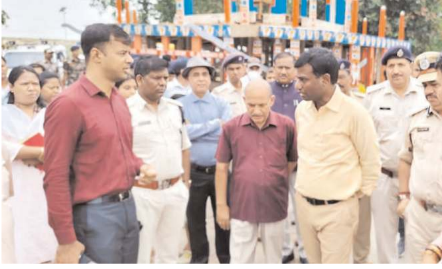
किया कि यात्रा मार्ग पर किसी प्रकार की बाधा न हो और श्रद्धालुओं को कोई असुविधा न हो। वरिय पुलिस

इस दौरान उपायुक्त ने जगन्नाथपुर मंदिर से मौसीवाड़ी तक रथ यात्रा के मार्ग का भौतिक निरीक्षण किया और श्रद्धालुओं के निर्बाध आवागमन को सुनिश्चित करने का निर्देश दिया। उन्होंने संबंधित अधिकारियों को निर्देशित