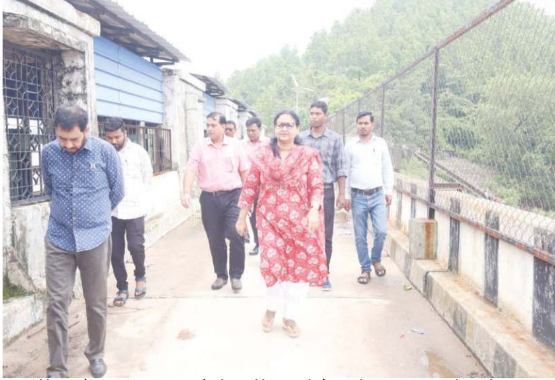
दिखाई देने लगा है। बढ़ी हुई जलधारा और सेल्फी लेने पहुंच रहे हैं, जिससे की गंभीरता को भांपते हुए जिला प्रशासन पूरी तरह सतर्क हो गया है।

लगातार वर्षा के कारण केलाघाघ डैम का जलस्तर खतरों के निशान को पार कर गया है। डैम के सभी फाटक ओवरफ्लो कर रहे हैं, जिससे आसपास के इलाकों में जलभराव की स्थिति बन रही है। डैम संचालक द्वारा फाटक खोले जा रहे हैं। वहीं, दानगढ़ी के पास स्थित शंख नदी भी उफान पर है। नदी का पानी तेजी से बढ़ रहा है, जिससे यह स्थल और अधिक आकर्षक