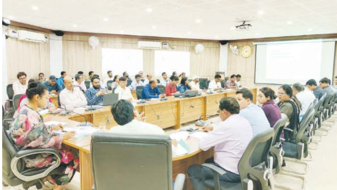
गए। इसके तहत एएनसी रजिस्ट्रेशन, संस्थागत प्रसवफैमिली प्लैनिंग, ई-संजीवनी (टेलीमेडिसिन) की समीक्षा कर अद्यतन स्थिति से अवगत होने का कार्य किया गया। उपायुक्त गुमला ने सभी प्रभारी चिकित्सा पदाधिकारी एवं कम्युनिटी हेल्थ ऑफिसर को निर्देशित किया कि अपने अपने स्वास्थ्य केंद्रों में लक्ष्य निर्धारित कर काम करें। सहिया के कार्यों को समय समय पर

गुमला : गुमला स्वास्थ्य विभाग की जिला स्तरीय समीक्षात्मक बैठक का आयोजन आज उपायुक्त प्रेरणा दीक्षित की अध्यक्षता में समाहरणालय के सभाकक्ष में संपन्न की हुई। जिला स्तरीय स्वास्थ्य विभाग की इस समीक्षात्मक बैठक में विभाग से संबंधित एक साथ कई योजनाओं की समीक्षा करते हुए आवश्यक दिशा निर्देश दिए गए। स्वास्थ्य विभाग के समीक्षा के दौरान जिले एवं प्रखंड के विभिन्न स्वास्थ्य केंद्रों पर स्वास्थ्य सुविधाओं, चिकित्सकों की उपलब्धता की अद्यतन स्थिति से अवगत होते हुए आवश्यक दिशा निर्देश दिए गए। आयुष्मान कार्ड योजना, आभा कार्ड निर्माण आदि विषयों पर भी चर्चा की गई। विभिन्न प्रखंडों में स्वास्थ्य उप केंद्रों के भवन, आधारभूत सुविधा सहित अन्य पहलुओं पर विस्तृत समीक्षा की गई। नीति आयोग के विभिन्न इंडिकेटर्स की समीक्षा करते हुए आवश्यक दिशा निर्देश दिए