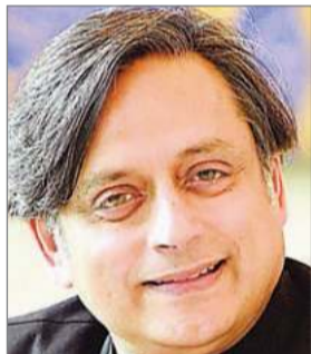
साथ निकटता से मिलकर काम

नई दिल्ली: कांग्रेस कार्य समिति (सीडब्ल्यूसी) के सदस्य शशि थरूर ने गुरुवार को यह स्वीकार किया है कि पार्टी नेतृत्व में कुछ नेताओं से उनके मतभेद हैं, लेकिन नीलांबुर निर्वाचन क्षेत्र में उपचुनाव के मद्देनजर वह इस बारे में बात नहीं करेंगे। थरूर ने कहा कि कांग्रेस, उसके मूल्य और उसके कार्यक्रमों उन्हें बहुत प्रिय हैं। उन्होंने कहा कि उन्होंने 16 वर्ष तक पार्टी कार्यकर्ताओं के