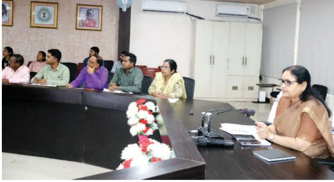
बांसजोर प्रखंड में प्रमाणन प्राप्त करने पर विशेष ध्यान देने के निर्देश दिए। इसके साथ ही गर्भवती महिलाओं के प्रथम