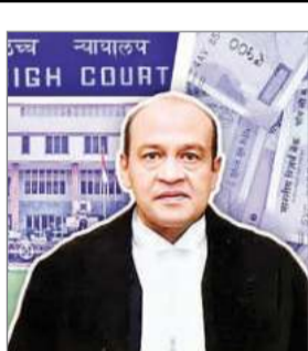
पूर्व न्यायाधीश जस्टिस यशवंत वर्मा के खिलाफ महाभियोग प्रस्ताव लाने की मांग की है।

नई दिल्ली: बीते मार्च में अपने आवास के स्टोर रूम से बड़ी मात्रा में अधजले कैश मिलने के बाद विवादों में घिरे जस्टिस यशवंत वर्मा की मुश्किलें बढ़ती हुईं नजर आ रही हैं। 22 मार्च को सुप्रीम कोर्ट द्वारा गठित तीन दिवसीय जांच समिति ने अपनी रिपोर्ट में बताया है कि स्टोर रूम पर जस्टिस वर्मा के परिवार की पूरी निगरानी थी और वहां किसी को भी जाने की इजाजत नहीं थी। इन तथ्यों को देखते हुए समिति ने दिल्ली हाई कोर्ट के