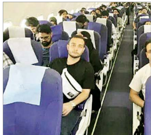
खुश नजर आए। उन्होंने कहा कि भारत सरकार ने उनका साथ दिया इसलिए आज वह वापस अपने घर आ पाए हैं।

नई दिल्ली: ईरान और इजरायल के बीच हालात लगातार खराब होते जा रहे हैं। भारत सरकार ने अपने नागरिकों की सुरक्षा को ध्यान में रखते हुए ह्यऑपरेशन सिंधु की शुरुआत की है। इस ऑपरेशन के तहत सरकार ने ईरान में फंसे भारतीयों को सुरक्षित बाहर निकालने का काम शुरू कर दिया है। भारत सरकार की तरफ से 110 भारतीय छात्रों को ईरान से निकालकर पहले आर्मेनिया पहुंचाया गया।