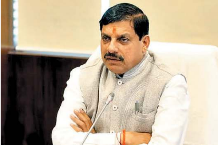
12.62 एकड़ भूमि उपलब्ध कराई गई है। इसमें से 9 हजार 533 वर्गमीटर भूमि पर विद्यालय भवन का निर्माण किया गया है। अत्याधुनिक शैक्षणिक सुविधाओं से युक्त सांदीपनि विद्यालय के भूतल सहित तीन मंजिला भवन में 34 क्लास रूम बनाये