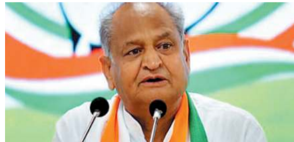
कोविड काल में अनाथ हुए बच्चों के लिए 'मुख्यमंत्री कोरोना सहायता योजना' शुरू की गई थी। इसके तहत प्रत्येक अनाथ बच्चे को एक लाख रुपये की एकमुश्त सहायता, 18 वर्ष की उम्र तक हर माह 2500 रुपये और सालाना 2000 रुपये देने का प्रावधान था। इसके अलावा, ह्यापालनहार योजनाह के तहत पांच वर्ष तक के बच्चों को 500 रुपये प्रतिमाह और स्कूल में प्रवेश के बाद 18

जयपुर : पूर्व मुख्यमंत्री अशोक गहलोत ने अनाथ बच्चों की हालत को लेकर राज्य सरकार पर निशाना साधा है। उन्होंने कहा कि यह बेहद दुर्भाग्यपूर्ण है कि भाजपा सरकार जरूरतमंद अनाथ बच्चों को सामाजिक सुरक्षा नहीं दे पा रही है, जिसके कारण मासूम बच्चे सड़कों पर भीख मांगने को मजबूर हैं। गहलोत ने शनिवार को सोशल मीडिया प्लेटफॉर्म 'एक्स' पर पोस्ट करते हुए लिखा कि सरकार की ज्यादातर योजनाएं सिर्फ कागजों में ही रह गई हैं। जमीनी स्तर पर इनका लाभ जरूरतमंदों को नहीं मिल पा रहा है। गहलोत ने अपनी सरकार के दौरान शुरू की गई योजनाओं का उल्लेख करते हुए बताया कि