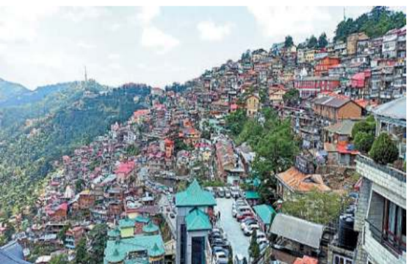
शनिवार को सबसे कम न्यूनतम तापमान लाहौल-स्पीति जिले के ताबो में 4.7 डिग्री सेल्सियस रिकॉर्ड किया गया, जो पहाड़ी क्षेत्रों में रात के समय की ठंड को दर्शाता है। शिमला में न्यूनतम तापमान 16.5 डिग्री, मनाली में 13.7 डिग्री, कल्पा में 10.6 डिग्री, केलंग में 7.3 डिग्री, कुकुमसेरी में 8.3 डिग्री, सियोबाग में 13.5 डिग्री, भरमौर में 15 डिग्री,

शिमला : हिमाचल प्रदेश में आगामी दिनों में मौसम शुष्क बना रहेगा, जिससे तापमान में उछाल आएगा। मौसम विज्ञान केंद्र शिमला द्वारा शनिवार को जारी बुलेटिन के अनुसार राज्य के अधिकांश भागों में सात जून से 11 जून तक बारिश की कोई संभावना नहीं है, जबकि 12 और 13 जून को कुछ क्षेत्रों में छिटपुट वर्षा हो सकती है। इससे पहले राज्य में अधिकतम और न्यूनतम तापमान में उल्लेखनीय वृद्धि दर्ज की गई है। बुलेटिन के अनुसार बीते 24 घंटों में कई क्षेत्रों में न्यूनतम तापमान सामान्य से 2 से 4 डिग्री सेल्सियस ऊपर रिकॉर्ड किया गया है, जबकि कुछ स्थानों पर यह सामान्य रहा। इसी तरह अधिकतम तापमान में भी कई जगहों पर वृद्धि देखी गई है वहीं कुछ स्थानों पर यह सामान्य या थोड़ा नीचे रहा।