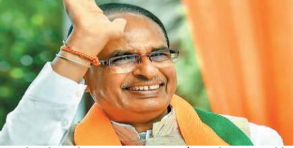
एक्सटेंसिबल में आयोजित विकास कार्यों के लोकार्पण एवं भूमिपूजन कार्यक्रम में शामिल होंगे। इसके पश्चात केन्द्रीय कृषि मंत्री शाम 05:20 बजे भोपाल के लिए प्रस्थान करेंगे। वहीं, मुख्यमंत्री डॉ मोहन यादवभोपाल से प्रस्थान कर दोपहर 02:30 बजे इच्छावर के लिए प्रस्थान करेंगे और दोपहर 03 बजे इच्छावर स्थित दशहरा मैदान में विकसित कृषि संकल्प अभियान के कार्यक्रम में शामिल होंगे। इसके पश्चात केन्द्रीय कृषि मंत्री शाम 05 बजे इच्छावर से प्रस्थान कर भाउखेड़ी पहुंचेंगे और

सीहोर : केन्द्रीय कृषि मंत्री शिवराज सिंह चौहान आज (शनिवार को) मध्य प्रदेश के सीहोर जिले के प्रवास पर रहेंगे। इस दौरान वे सीहोर में स्थित प्रधानमंत्री कॉलेज ऑफ एक्सटेंसिबल में आयोजित कार्यक्रम में लगभग 100 करोड़ के विकास कार्यों का लोकार्पण एवं भूमिपूजन करेंगे। इसके साथ ही वे विभिन्न योजनाओं के अनेक हितप्रार्थियों को योजनाओं के स्वीकृति पत्र प्रदान कर लाभान्वित भी करेंगे। कार्यक्रम में मुख्यमंत्री डॉ मोहन यादव भी मौजूद रहेंगे। सीहोर कलेक्टर बालागुरु के. ने बताया कि केन्द्रीय कृषि मंत्री चौहान भोपाल से प्रस्थान कर दोपहर 1:20 बजे सीहोर पहुंचेंगे और वहाँ प्रधानमंत्री कॉलेज ऑफ