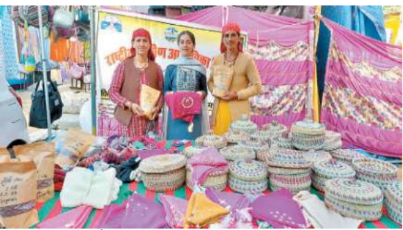
टोकरियाँ, ऊनी जैकेट, देशी घी, हल्दी, राजमाह, मोटे अनाज के बीज, हाथ से बनी सजावटी वस्तुएं, आचारझमसाले आदि उपलब्ध हैं। प्रतिमाह यहाँ 25-30 हजार रुपये का कारोबार होता है, जिससे पूरे समूह की सामूहिक

मंडी : मंडी जिले की चुराग विकास खंड की ग्राम पंचायत सर्वा माहू के अंतर्गत दानवीर कणा श्री मूल माहूनाग मंदिर के गांव की महिलाओं द्वारा दो वर्ष पूर्व शुरू हिम इरा शॉप आज आत्मनिर्भरता का प्रतीक बन चुकी है। जहां कभी वे केवल घर की चारदीवारी तक सीमित थीं, वहीं इस शॉप के माध्यम से 100 से अधिक महिलाएं पारंपरिक शिल्प और उत्पादों को नए बाजारों तक पहुंचाकर सालाना एक निश्चित आय अर्जित कर रही हैं। माहूनाग मंदिर के ठीक पास स्थित इस शॉप में 20 विभिन्न उत्पाद-बांस की