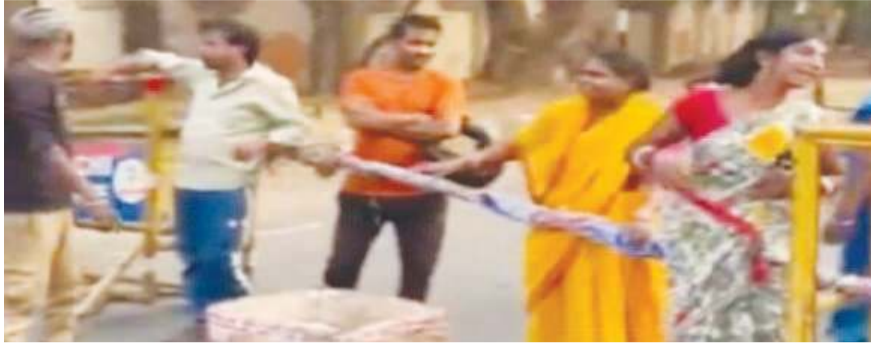
हटाने का काम किया गया। नगर निगम के 100 से अधिक दुकानों को जब्त किया, कई अवैध निर्माण

रांची: शहर के मोरहाबादी मैदान इलाके में बुधवार की रात नगर निगम की ओर से अतिक्रमण हटाओं अभियान चला। इस दौरान 100 से अधिक दुकानों को नगर निगम की टीम ने जब्त कर लिया। नगर निगम की कार्यवाही का जैसे ही दुकानदारों को पता चला उन्होंने प्रदर्शन करना शुरू कर दिया। मोरहाबादी के बिजली ऑफिस से लेकर पंचमुखी मंदिर तक नगर निगम की ओर से अतिक्रमण