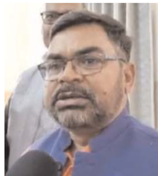
की संयुक्त कार्रवाई का यह स्ट्राइक आरंभ है, पर प्रचंड है। हिंद की सेना