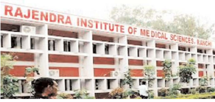
जूनियर डॉक्टरों के अनुसार, आरोपी का फुटेज सीसीटीवी में

रांची: राज्य के सबसे बड़े अस्पताल रिम्स की सुरक्षा व्यवस्था पर एक बार फिर सवाल उठा है। बीते मंगलवार की रात अस्पताल के फर्स्ट फ्लोर पर सर्जरी वार्ड में ड्यूटी कर रही महिला डॉक्टर के साथ एक अज्ञात व्यक्ति ने छेड़खानी की। महिला डॉक्टर ने इसका विरोध करते हुए आरोपी शख्स को पकड़ने की कोशिश की लेकिन वह सीढ़ी से पहले तीसरी मंजिल पर गया और फिर दूसरे रास्ते से रिम्स के बाहर भाग गया।