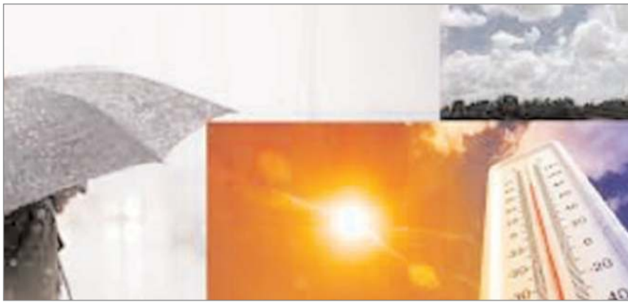
क्रिया गया है। एक साइक्लोनिक सर्कुलेशन उत्तर-पूर्व से छत्तीसगढ़ होते हुए रांची को छोड़कर अन्य जिलों में अधिकतम तापमान लगभग 40

रांची: राज्य में अगले तीन दिन तक लू की स्थिति बनी रहेगी। इसको देखते हुए मौसम विभाग ने येलो अलर्ट जारी कर दिया है। इसके बाद अधिकतम तापमान में तीन से पांच डिग्री तक कमी आ सकती है। 26 अप्रैल को उत्तर-पूर्व तथा दक्षिण-पूर्व इलाके में मौसम में बदलाव दिखाया। बादल छाये रह सकते हैं, जबकि, 27 अप्रैल को दोपहर बाद ओलावृष्टि के साथ तेज हवा, बारिश व वज्रपात होने का अनुमान है। इसे देखते हुए ऑरेंज अलर्ट जारी