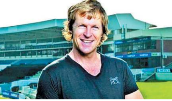
रायपुर। बेस्ट फील्डिंग के लिए मशहूर पूर्व अंतर्राष्ट्रीय क्रिकेट खिलाड़ी जॉटी रोड्स को चाहने वाले रायपुरिस के लिए एक अच्छी खबर है।

क्रिकफेस्ट में चयनित छात्रों को पूर्व अंतर्राष्ट्रीय क्रिकेट खिलाड़ी जॉटी रोड्स सिखाएंगे क्रिकेट के गुर