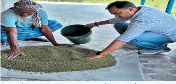
अपघटन के लिए मिलाकर हरी खाद बनाया जा सकता है।