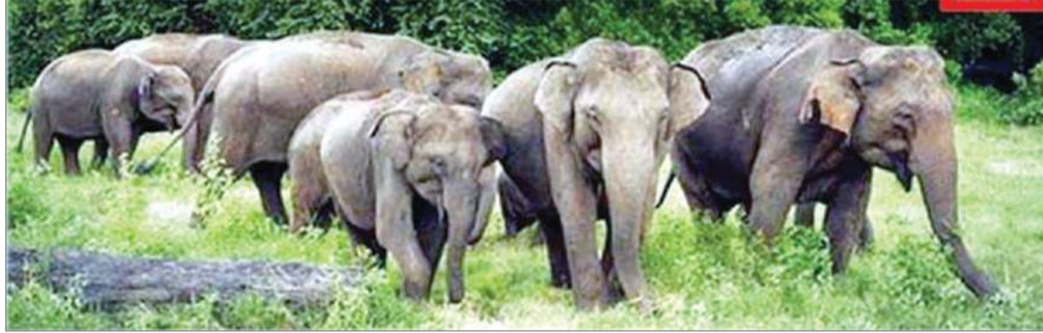
हाथियों के झुंड ने मचाया उत्पात

नई दिल्ली: दिल्ली पुलिस ने उत्तर प्रदेश में हाल ही में उठाए गए कदमों के समान एक कदम उठाते हुए शहर भर में लाउडस्पीकों और सार्वजनिक संबोधन प्रणालियों के उपयोग को विनियमित करने के लिए सख्त दिशानिर्देशों का एक सेट जारी किया है। नए नियमों का उद्देश्य ध्वनि प्रदूषण को नियंत्रित करना और यह सुनिश्चित करना है कि ध्वनि का स्तर निर्धारित सीमा के भीतर रहे, खासकर आवासीय और मौन क्षेत्रों में। आदेश के अनुसार, धार्मिक स्थानों पर अनुमत ध्वनि स्तर से अधिक लाउडस्पीकर का उपयोग नहीं किया जा सकता है, और सार्वजनिक समारोहों, धार्मिक कार्यक्रमों और रैलियों सहित किसी भी स्थान पर लाउडस्पीकर स्थापित करने या संचालित करने के लिए पुलिस से पूर्व अनुमति अनिवार्य है। टैट हाउस से किराए पर लिए गए लाउडस्पीकर भी उसी नियम के अंतर्गत आते हैं - अपूर्णकताओं को यह सत्यापित करना आवश्यक है कि उपयोगकर्ताओं के पास लिखित पुलिस अनुमोदन है। जिला पुलिस उपयुक्त (डीसीपी) को अनुपालन सुनिश्चित करने का निर्देश दिया गया है, और इन नियमों का उल्लंघन करने वाले विक्रेताओं के खिलाफ कानूनी कार्रवाई की जाएगी।