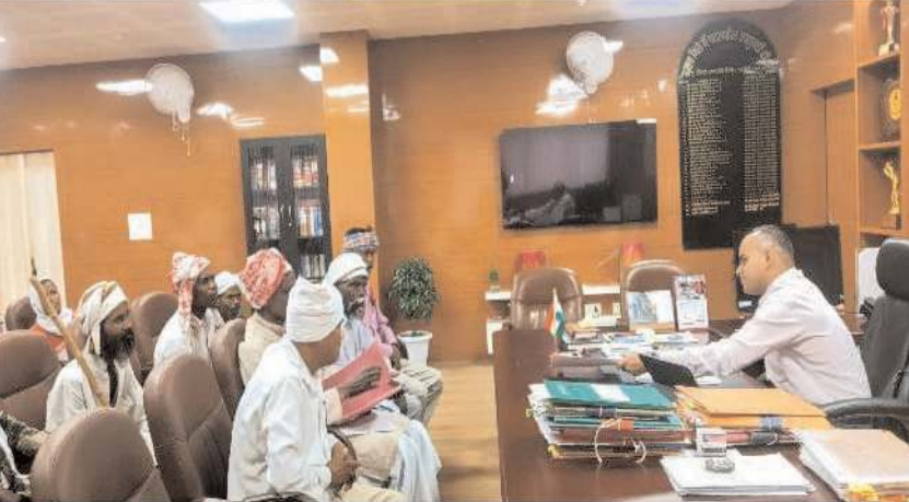
जाएगा। आंगनबाड़ी केंद्र में आंगनबाड़ी बसिया के बोड़ेकेरा बरटोली स्थित सेविका उपस्थित नहीं रहती, जिसके कारण बच्चों को काफी परेशानी होती है। इस हेतु ग्रामीणों

मेट्रो रेज संवाददाता गुमला : गुमला मुख्यालय स्थित उपायुक्त कार्यालय में नागरिकों की समस्याओं के त्वरित निवारण हेतु आयोजित साप्ताहिक जन शिकायत निवारण दिवस में उपायुक्त गुमला कर्ण सत्यार्थी की अध्यक्षता में आम जनों के विभिन्न मुद्दों की सुनवाई की गई। जिले के शहरी व ग्रामीण क्षेत्र से आए लोगों ने अपनी अपनी समस्याओं को उपायुक्त गुमला के समक्ष रखा। इस दौरान उन्होंने उपस्थित सभी ग्रामीणों से एकझंका कर उनकी समस्याएं सुनी एवं शिकायतन दिया कि उनके सभी शिकायतों की जल्द से जल्द जांच कराते हुए शिकायतों का समाधान किया