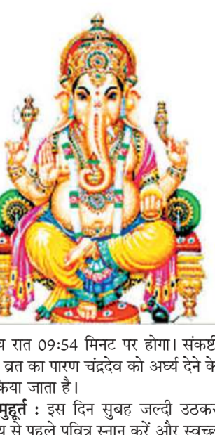
चंद्रोदय रात 09:54 मिनट पर होगा। संकष्टी चतुर्थी व्रत का पापण चंद्रदेव को अर्घ्य देने के बाद किया जाता है। पूजा मुहूर्त : इस दिन सुबह जल्दी उठकर सूर्योदय से पहले पवित्र स्नान करें और स्वच्छ

हर साल वैशाख माह के कृष्ण पक्ष की चतुर्थी तिथि को विकट संकष्टी चतुर्थी का व्रत किया जाता है। विकट संकष्टी चतुर्थी के दिन भगवान गणेश की विधि-विधान से पूजा-अर्चना की जाती है। यह व्रत भक्तों को सभी समस्याओं से मुक्ति दिलाने में सहायक होता है। इस बार 16 अप्रैल 2025 को विकट संकष्टी चतुर्थी का व्रत किया जा रहा है। भगवान गणेश को विघ्नहर्ता और शुभाशुभ के देवता के रूप में पूजा की जाती है। यह तिथि भगवान गणेश की कृपा और आशीर्वाद पाने के लिए बेहद अच्छी मानी जाती है। तो आइए जानते हैं विकट संकष्टी चतुर्थी की तिथि, मुहूर्त और पूजन विधि के बारे में... तिथि और मुहूर्त : हिंदू पंचांग के मुताबिक कृष्ण पक्ष में आने वाली चतुर्थी तिथि 16 अप्रैल को दोपहर 01:16 मिनट से शुरू हो रही है। वहीं 17 अप्रैल को दोपहर 03:32 मिनट पर इस तिथि की समाप्ति होगी। इस दिन