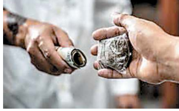
आ रहे हैं। कहां-कहां होती है बिक्री : ये नशा के कारोबारी एलसी रोड, अंजुमन नगर, जयप्रकाश चौक के गली, महादेवगंज, मदन शाही, जीरवावाड़ी, सहित कई अन्य जगहों पर बेचने की सूचना मिलती रहती है। जिला प्रशासन की ओर से तंबाकू से होने वाली घतक

साहिबगंज : इन दिनों जिला सहित आसपास ग्रामीण क्षेत्र में नशे के कारोबारी धीरे-धीरे बढ़ता नजर आ रहा है। सूत्रों की माने तो गांजा, सादा पउडर, सिर्फ, सुलेशन, जैसे कई तरह के नशा का व्यापार किया जा रहा है। विदित हो कि जिरवावाड़ी थाना क्षेत्र या नगर थाना क्षेत्र में यह नशे की कारोबारी फल फूल रहे हैं। शाम होते ही प्रत्येक चौक-चौराहा पर नशेइत्यों की जमावड़ा सा लग जाता है। हालांकि पुलिस-प्रशासन के द्वारा कई बार इस ओर नकल कसने की कोशिश भी किया गया है। फिर भी यह थमने का नाम नहीं ले रहा है। आखिर क्यों जिला पुलिस-प्रशासन को नशे की कारोबारी खुला चुनौती देते नजर