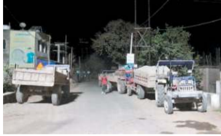
पोश मिट्टी माफिया अवैध रूप से मिट्टी खनन कर उस मिट्टी को ऊंचे दाम पर चिमनी भट्टा को बेचा जाता है। ट्रैक्टर के चक्के से उड़ रहे धूल कण से परेशान लोगों ने इसका शिकायत कई बार स्थानीय प्रशासन से की लेकिन इस दिशा में कोई सकारात्मक कार्रवाई नहीं किया गया था। बुधवार को जिला प्रशासन ने बड़ी कार्रवाई की है।

साहिबगंज : राधानगर थाना क्षेत्र के कटाहलबाड़ी मुख्य सड़क पर बुधवार देर रात जिला खनन पदाधिकारी व जिला परिवहन पदाधिकारी ने संयुक्त रूप से छापेमारी कर एक दर्जन से अधिक मिट्टी लदा व खाली ट्रैक्टर को जब्त किया। अवैध मिट्टी खनन पर जिला प्रशासन की कार्रवाई करते हुए राधानगर थाना क्षेत्र के कटाहलबाड़ी मुख्य सड़क पर बुधवार देर रात जिला खनन पदाधिकारी और जिला परिवहन पदाधिकारी ने संयुक्त रूप से छापेमारी कर एक दर्जन से अधिक मिट्टी लदा व खाली ट्रैक्टर को किया जब्त। जब्त किया गया सभी ट्रैक्टर को सुरक्षित राधानगर थाना को सुर्द कर दिया गया है। विदित हो कि उधवा प्रखंड के उत्तर पलाशागछी पंचायत स्थित गंगा नदी किनारे स्थानीय एक जनप्रतिनिधि और कुछ सफेद