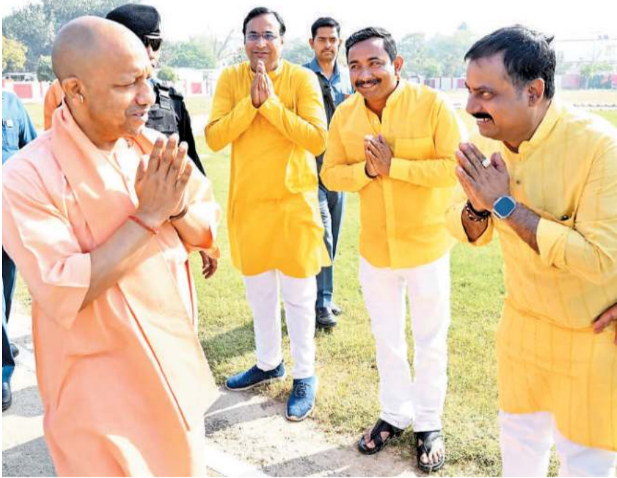
से अन्नपूर्णा मंदिर में लगभग 30 मिनट का समय बिताते हुए उन्होंने माता रानी का विधिवत दर्शन पूजन किया और माता रानी की और विग्रह की आरती की। दर्शन के पश्चात मुख्यमंत्री ने साधु-संतों के साथ प्रसाद ग्रहण किया। इस दौरान उन्होंने अन्नपूर्णा मंदिर में हाल ही में आयोजित कुंभाभिषेक आयोजन की जानकारी ली। मंदिर में 21 ब्राह्मणों ने