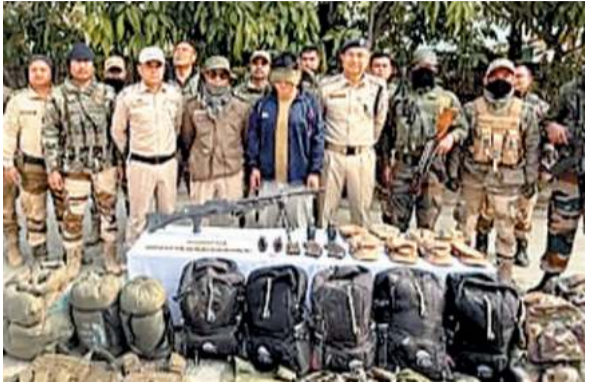
कारतूस, हैंड ग्रेनेड, रेडियो सेट, बुलेटप्रूफ जैकेट, कैमोफ्लाज कपड़े, स्टाम्प पैड और मोबाइल फोन बरामद हुआ है।