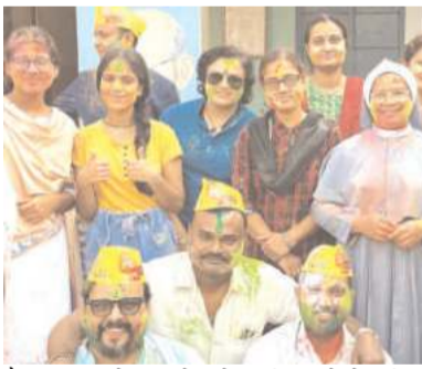
हैंड्स आदि के सहयोग से सभी बच्चों के बीच