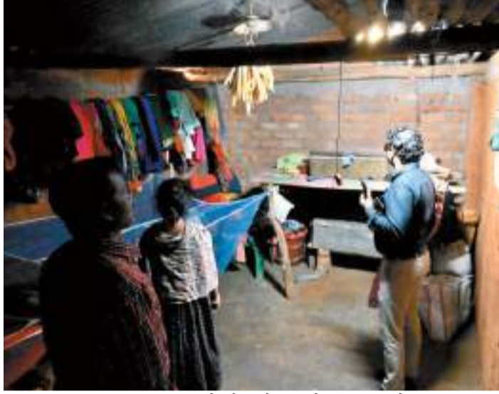
का प्रशिक्षण दिया जाएगा, जिससे वे रोजगार के नए अवसरों का सृजन कर

साहिबगंज: बोरियो प्रखंड के करमपहाड़ में उपायुक्त हेमंत सती के कर-कमलों द्वारा अनाबद्ध निधि योजना अंतर्गत 30 दिवसीय हस्तशिल्प प्रशिक्षण कार्यक्रम का विधिवत शुभारंभ किया गया। जबकि उपायुक्त ने प्रशिक्षण में भाग लेने वाले प्रतिभागियों को टूल किट भी वितरित किए जिससे उन्हें कार्य सीखने और आत्मनिर्भर बनने में सहायता मिलेगी। स्थानीय युवाओं और परिवारों को मिलेगा रोजगार यह प्रशिक्षण कार्यक्रम करमपहाड़ के स्थानीय युवाओं और परिवारों को आत्मनिर्भर बनाने की दिशा में एक महत्वपूर्ण कदम साबित होगा। इस योजना के तहत प्रतिभागियों को बांस क्राफ्ट, सॉफ्ट टॉय निर्माण सहित अन्य हस्तशिल्प कलाओं