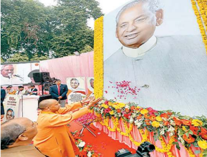
कल्याण सिंह ने कभी सिद्धांतों व मूल्यों से समझौता नहीं किया

एजेंसी लखनऊ : मुख्यमंत्री योगी आदित्यनाथ ने पूर्व मुख्यमंत्री व राज्यपाल 'पद्म विभूषण' कल्याण सिंह की जयंती पर 2, मॉल एवेन्यू में आयोजित कार्यक्रम में उनके चित्र पर पुष्पांजलि अर्पित की। मुख्यमंत्री ने कहा कि उनकी स्मृतियों की जीवंतता बनाए रखने के लिए प्रदेश सरकार ने लखनऊ में अत्याधुनिक कैसर इंस्टीट्यूट और बुलंदशहर के मेडिकल कॉलेज का नामकरण भी कल्याण सिंह के नाम पर रखा है। मुख्यमंत्री योगी आदित्यनाथ ने कहा कि कल्याण सिंह भारत मां के महान सपूत, राष्ट्रभक्त व रामभक्त थे। 1932 में अलीगढ़ के एक छोटे से गांव में आज ही के दिन सामान्य किसान परिवार में उनका जन्म हुआ था। बाल्यकाल से ही देश की आजादी की लड़ाई को देखने, स्वतंत्रता के बोध व भावी भारत के निर्माण में हमारी क्या भूमिका होगी, इन सवालों से ओतप्रोत बालक कल्याण सिंह ने उस समय राष्ट्रीय स्वयंसेवक संघ की सामान्य शाखा से लेकर आगे के कार्यक्रमों के माध्यम से खुद को राष्ट्रभक्ति के सांचे में ढाला था। किसान, शिक्षक, 1977 में प्रदेश के स्वास्थ्य मंत्री, विधायक, सांसद, दो बार प्रदेश के मुख्यमंत्री व दो राज्यों के राज्यपाल के रूप में उनकी कार्यकुशलता, कर्मठता व प्रशासनिक क्षमता को दक्षता को हर किसी ने स्वीकार किया।