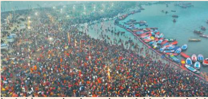
में छाई हुई है। महाकुंभ के पहले स्नान के मुख्यमंत्री योगी आदित्यनाथ ने भी दी पर्व की बधाई वाराणसी के सांसद और देश के प्रधानमंत्री नरेन्द्र मोदी और प्रदेश

महाकुंभ नगर : पौष पूर्णिमा सोमवार से दिव्य भव्य प्रयागराज महाकुंभ की शुरुआत तड़के तीन बजे से ही हो गई। पवित्र संगम तट पर डुबकी लगाने के लिए आधी रात के बाद ही पहुंच रहे श्रद्धालुओं के हजूम पर इंद्रदेव ने भी बूढ़ाबांढी कर स्वागत किया। कड़ाके की ठंड और सर्द हवाओं पर सनातनियों की आस्था भारी रही। तड़के से ही त्रिवेणी में हर-हर गंगे, हर-हर महादेव, जय-जय श्री राम के गगनभेदी जयकारों के बीच स्नान का अनवरत सिलसिला शुरू हो गया है। इसकी तस्वीरें भोर से ही सोशल मीडिया