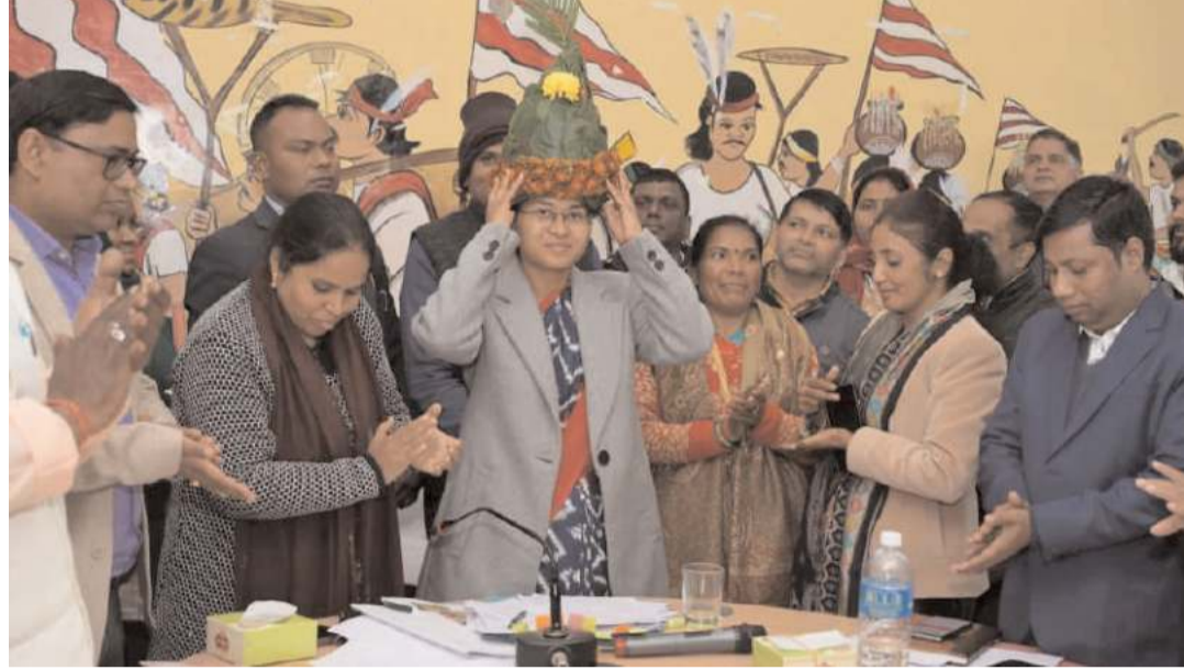
उन्होंने यह भी निर्देश दिया कि विकास योजनाओं को लागू करने में आ रही

बैठक के दौरान विभिन्न विभागों जैसे शिक्षा, स्वास्थ्य, आवास, मनरेगा, 15वीं वित्त योजना, खरखट्ट, समाज कल्याण, पेयजल और स्वच्छता, बिजली, वन, और भूमि संबंधी मामलों पर गहन चर्चा हुई। मंत्री तिर्की ने स्पष्ट रूप से कहा कि सरकार द्वारा चलाई जा रही योजनाओं का लाभ जनता तक पहुंचाने में अधिकारियों को पूरी गंभीरता दिखानी