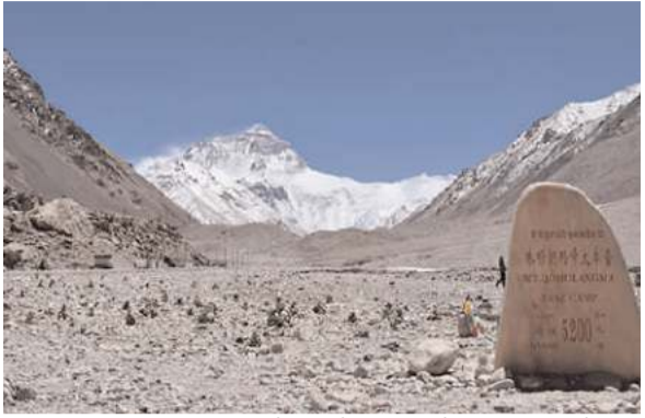
जिजांग (तिब्बत) स्वायत्त क्षेत्र में डिंगरी काउंटी में 7.1 तीव्रता के भूकंप के बाद पर्यटकों की सुरक्षा को ध्यान में रखते हुए

काठमांडू। नेपाल-चीन सीमा पर मंगलवार को शिमासे क्षेत्र में आए शक्तिशाली भूकंप के झटके के बाद दुनिया की सबसे ऊंची चोटी माउंट एवरेस्ट पर चीनी क्षेत्र से चढ़ाई पर चीन प्रशासन की तरफ से रोक लगा दी गई है। माउंट एवरेस्ट को चीन में माउंट कोमोलान्गमा के नाम से जाना जाता है। चीन की सरकारी मीडिया समाचार एजेंसी सिन्हूआ के मुताबिक मंगलवार सुबह