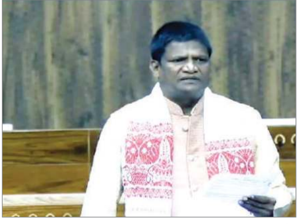
एक सीधी रेल सेवा शुरू की जानी चाहिए, जिससे श्रद्धालुओं को यात्रा में सुविधा मिले और उन्हें लंबी दूरी की यात्रा से बचने