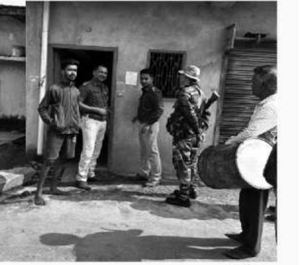
ह०/— पुलिस अधीक्षक, रामगढ़। PR 341966 (Police) 24-25 (D)