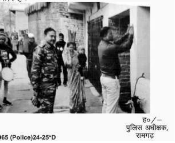
ह०/— पुलिस अधीक्षक, रामगढ़ PR 341965 (Police)24-25*D