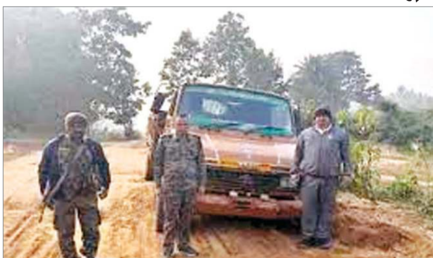
मेसरा थाना, दलादली टीओपी, तपुदाना, बेड़ो और लापुंग थाना क्षेत्रों से कुल 15 गाड़ियां पकड़ी गयीं। इसमें 12 गाड़ियों में अवैध बालू और तीन गाड़ियों में स्टोन चिप्स लोड था। वहीं 45

रांची : मुख्यमंत्री हेमंत सोरेन ने एक दिसंबर को सभी जिलों के डीसी को अवैध बालू उठाव पर तत्काल रोक लगाने का निर्देश दिया था। सीएम के आदेश के बाद रांची डीसी मंजुनाथ भजंत्री एक्शन मोड में हैं। अवैध बालू उठाव पर रोक लगाने के लिए उन्होंने संबंधित पदाधिकारियों को कई दिशा-निर्देश दिये हैं। डीसी के दिशा-निर्देश पर अवैध बालू उठाव रोकने के लिए अभियान चलाया जा रहा है। इसी के तहत मंगलवार की रात रांची जिला खनन पदाधिकारी और माइनिंग इंस्पेक्टर ने कई थाना क्षेत्रों में औचक निरीक्षण किया। इस दौरान