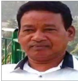
रहे। यह पीड़ा असहनीय है और उनकी कमी को कोई भी पूरा नहीं कर सकता। वे लंबे समय से बीमारी से संघर्ष कर रहे थे। आज सुबह हम सभी को छोड़कर चले गये। अर्जुन मुंडा ने बताया कि जमशेदपुर, घोड़ाबांधा स्थित घर

अर्जुन मुंडा ने सोशल मीडिया एक्स पर पोस्ट कर अपने बड़े भाई के निधन की जानकारी दी। उन्होंने लिखा कि व्यथित मन से बताना पड़ रहा है कि मेरे अभिभावक, मेरे बड़े भाई आदरणीय भीमसेन मुंडा जी अब हमारे बीच में नहीं रहे।