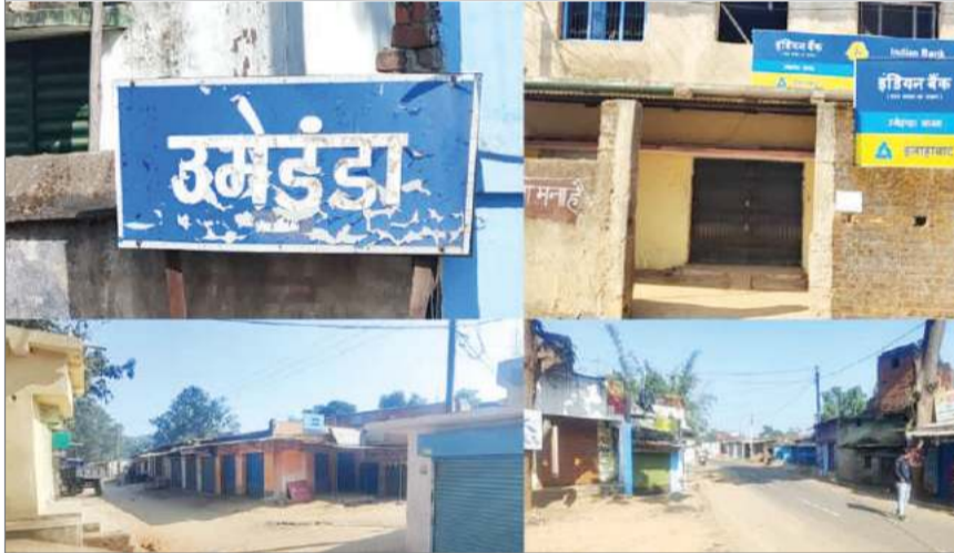
पांच सदस्य उमेडंडा पहुंचे थे और बाजार के दुकानदारों के साथ मारपीट करते हुए हथियार का भय