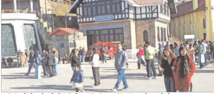
मंडी जिलों में घने कोहरे की चेतावनी दी गई है। 22, 25 व 26 दिसम्बर को मौसम के शुष्क रहने की संभावना है।

शिमला : हिमाचल प्रदेश में ठंड कहर बरपा रही है। राज्य के नौ शहरों का पारा माइनस में चल रहा है। पहाड़ी इलाकों के साथ मैदानी हिस्सों को भी शीतलहर ने जकड़ लिया है। लाहौल-स्पीति जिला में सीजन की सबसे ठंडी रात रही। इस जिला के ताबों में न्यूनतम तापमान सीजन में पहली बार शून्य से 14 डिग्री सेल्सियस नीचे दर्ज किया गया है। सर्दी से फिलहाल निजात नहीं मिलेगी और आगामी दिनों में कोहरा भी लोगों की परेशानी बढ़ाएगा। इसके साथ ही मौसम भी करवट लेगा और बारिश से फिर बर्फबारी देखने को मिलेगी। मौसम विभाग ने 23 व 24 दिसम्बर को पर्वतीय व उच्च पर्वतीय इलाकों में बर्फबारी का अनुमान बताया है। 27 दिसम्बर से फिर बर्फबारी व बारिश का दौर शुरू होने की संभावना है। मौसम विज्ञान केंद्र शिमला ने मैदानी व मध्यवर्ती इलाकों में 22 से 24 अक्टूबर तक शीतलहर का अलर्ट तथा 25 व 26 दिसम्बर को येलो अलर्ट जारी किया है। 24 व 25 दिसम्बर को बिलासपुर और