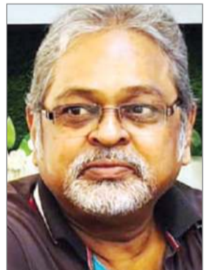
श्री आर्केश द्वारा लिखित सुलभ प्रेम दुर्लभ, एक सामाजिक और

पारिवारिक जीवन पर आधारित कहानियों का संग्रह है, जिसमें पन्द्रह कहानियों को संकलित किया गया है। इन कहानियों में यह दशाने का प्रयास किया गया है कि प्रेम के साथ रह कर कैसे जीवन को सरल बनाया जा सकता है। आपसी कलह और मनमुटाव के कारण जीवन की अशांति की वजह हूँदती कहानियाँ, वेशक अपनी सी लगेगी। परिवार और समाज में व्याप कठिन संघर्षों के बीच भी रिश्तों में मधुरता बनी रहे, तभी जीवन सार्थक है और यह सार्थकता प्रेम के साथ जुड़ कर ही