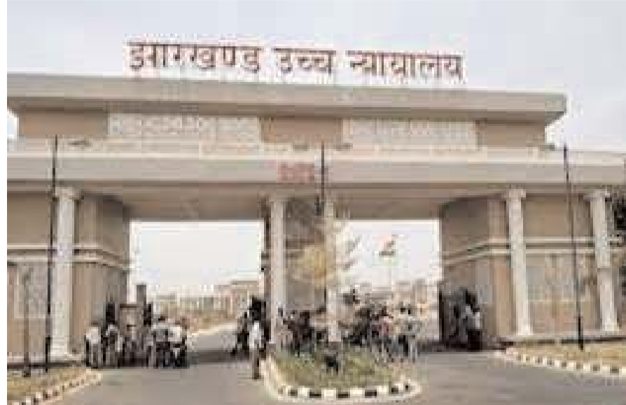
इसके बाद उच्च न्यायालय ने अधिकारियों को तलब किया था। डीजीपी और अन्य वरिष्ठ मामले की सुनवाई अगले साल

सैंपल नहीं लेती है। इससे मुकदमे के दौरान अभियोजन पक्ष को दिक्कत होती है। इसके चलते कई बार आरोपी रिहा कर दिए जाते हैं। इस पर हाईकोर्ट ने डीजीपी को निर्देश दिया कि वे मादक पदार्थों और दवाओं के नमूने लेने के लिए सख्त प्रक्रिया तय करें। इसके लिए नारकोटिक्स कंट्रोल ब्यूरो और राज्य सरकार के साथ मिलकर एसओपी बनाएं। अदालत ने पूर्वी सिंहभूम के बहरागोड़ा में एक वाहन जब्त किए गए 80 से 90 किलोग्राम मारिजुआना मामले का संज्ञान लिया। इस मामले में ठीक तरीके से दवाओं का सैंपल नहीं लिया गया और आरोपियों को बाद में उच्च न्यायालय से जमानत मिल गई।