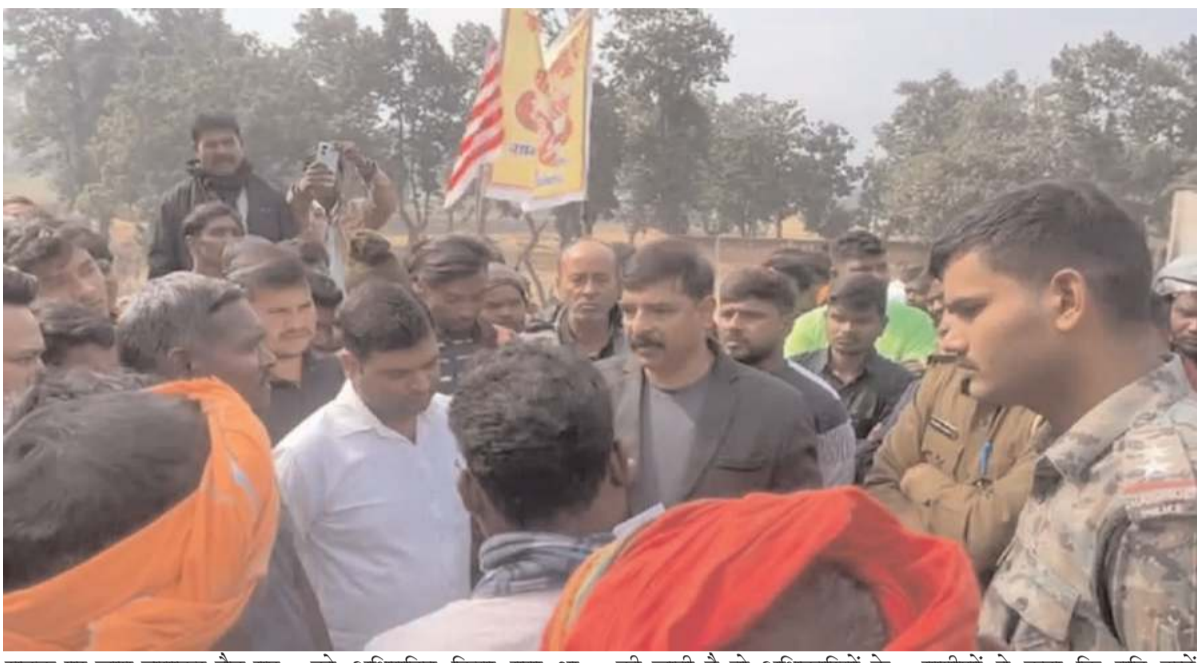
सड़क पर जाम लगाकर बैठ गए थे. ग्रामीणों ने बताया कि सड़क निर्माण के दौरान उनकी जमीन को अधिग्रहित किया गया था. जिस पर जमीन के बदले मुआवजा देने की बात कही गई थी, लेकिन जब भी इसकी मांग की जाती है तो अधिकारियों के द्वारा लगातार टाल मटोल किया जाता है. जिसके चलते मजबूरी में सड़क जाम करना पड़ा.

मेट्रो रेज संवाददाता लातेहार: जिले के बालूमाथ प्रखंड में जमीन के मुआवजे की मांग को लेकर ग्रामीणों ने लगभग 5 घंटे तक चंदवा-चतरा एनएच 99 को जाम कर दिया. हालांकि बाद में प्रशासनिक अधिकारियों के द्वारा उचित आश्वासन दिए जाने के बाद ग्रामीणों ने सड़क जाम हटा लिया. सड़क जाम के कारण लोगों को परेशानी का सामना करना पड़ा. दरअसल, लातेहार जिले के चंदवा से चतरा तक हो रहे सड़क निर्माण कार्य के लिए तीन साल पहले बालूमाथ प्रखंड के ग्रामीणों की जमीन अधिग्रहित कर ली गई थी. ग्रामीणों को आश्वासन दिया गया था कि उन्हें जमीन के बदले उचित मुआवजा दिया जाएगा, लेकिन तीन वर्ष तक मुआवजा नहीं मिला. जिसके बाद नाराज ग्रामीणों ने सोमवार को सड़क जाम कर दिया. सुबह 6:30 बजे से ग्रामीण