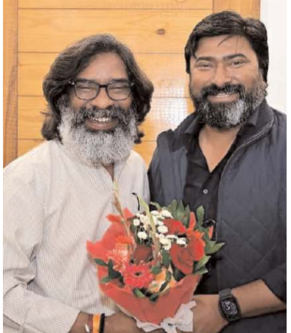
नवनिर्वाचित विधायकों को भी नए मंत्रीमण्डल के विस्तारीकरण बुके देकर शुभकामनाएं दी है, साथ को लेकर भी बधाईयां दी है।