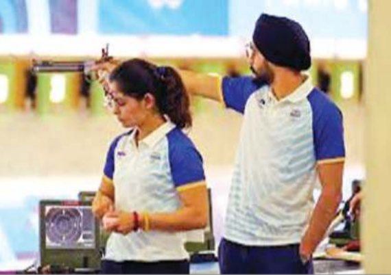
पेरिस ओलंपिक 2024