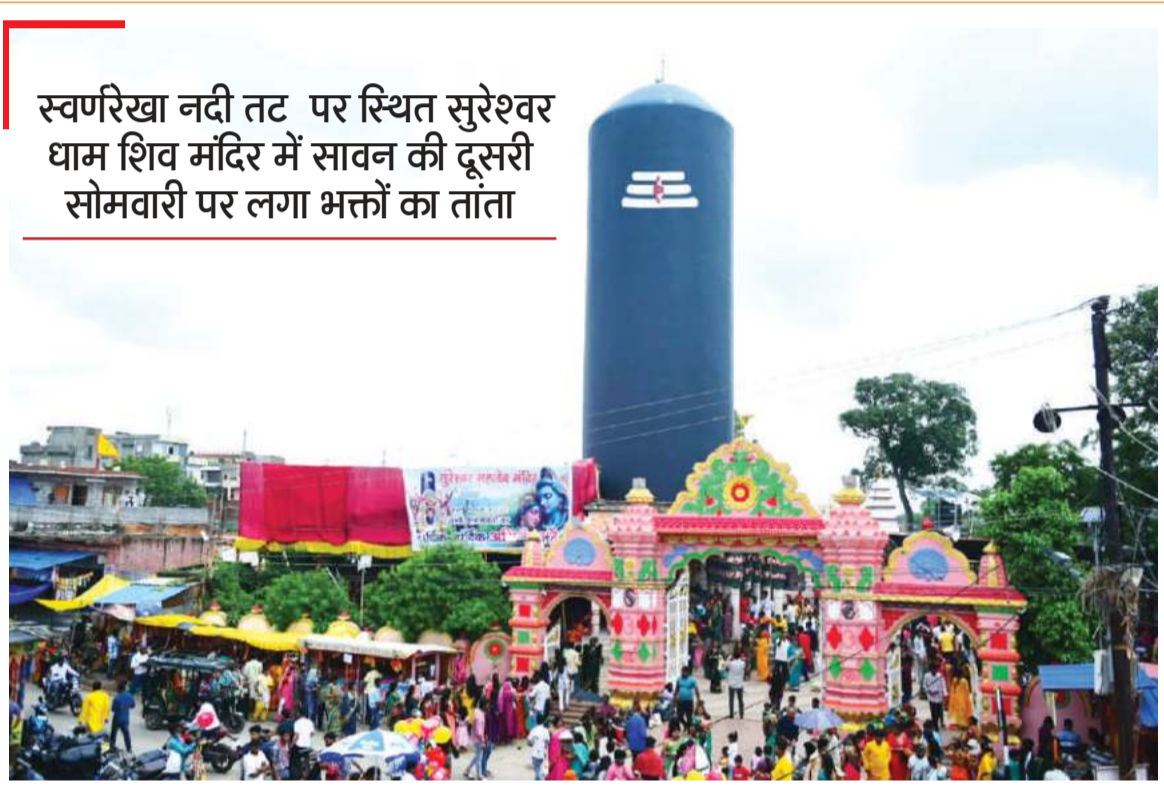
स्वर्णरेखा नदी तट पर स्थित सुरेश्वर धाम शिव मंदिर में सावन की दूसरी सोमवारी पर लगा भक्तों का तांता